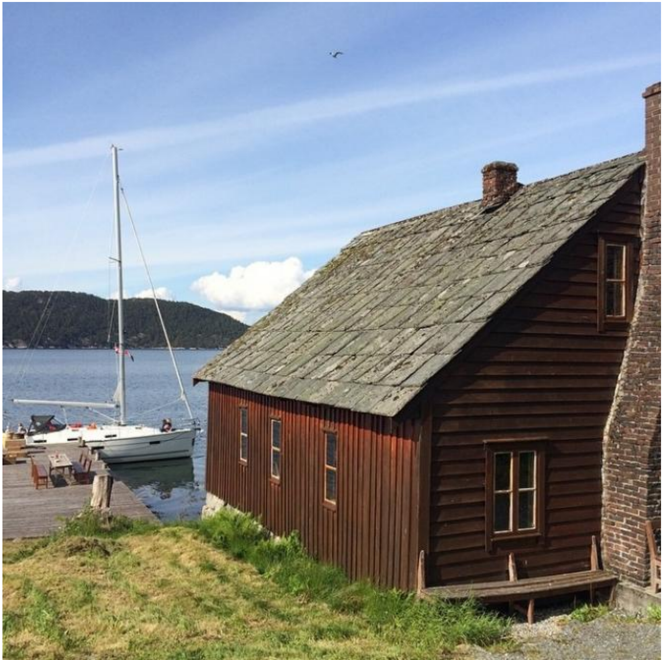
Bøkkerverkstaden på Rød er eit særeige kulturminne i Kvinnherad

Tekst/foto: Kristian Bringedal Nett: Thor Inge Døssland