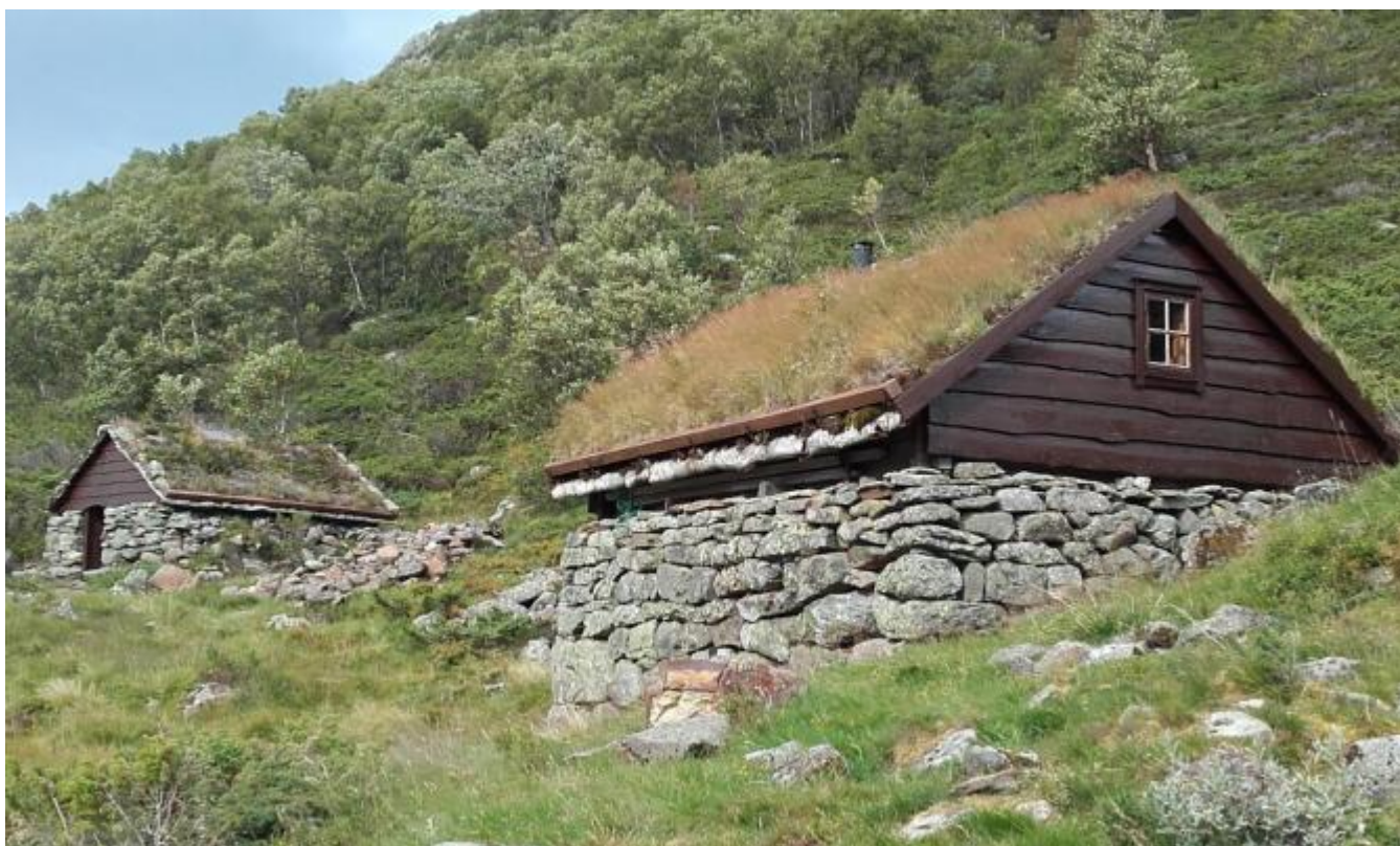
Støishusa på Vatnastøl er eit døme på vern og bruk av kulturminne

Planprogram til Kommunedelplan for kulturminne i Kvinnherad ligg ute til høyring. Personar og organisasjonar vert inviterte til å ta del i planarbeidet med registrering og formidling av kulturminne. Uskedal utvikling er høyringspart i viktige kommunale plansaker. Meir informasjon om arbeidsmetoden kjem fram på møte onsdag 2.mars i Gamleskulen.