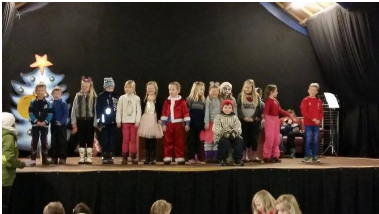
2. klasse song fint til nissen