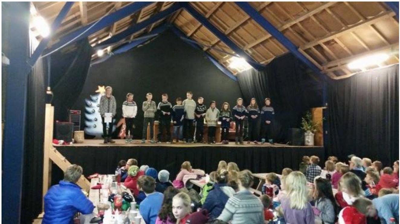
7.klasse les juleevangeliet.