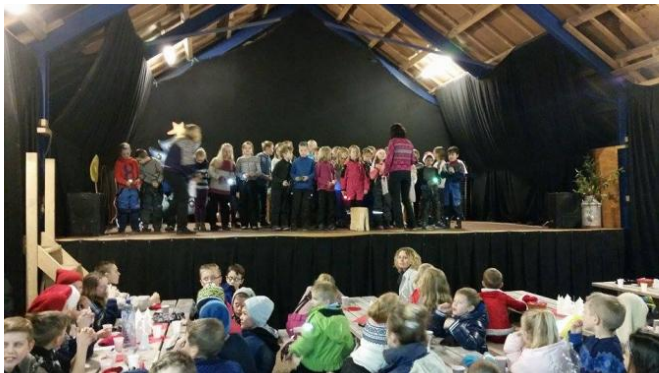
3. og 4. klasse song veldig fint i Vi tenner våre lykter.