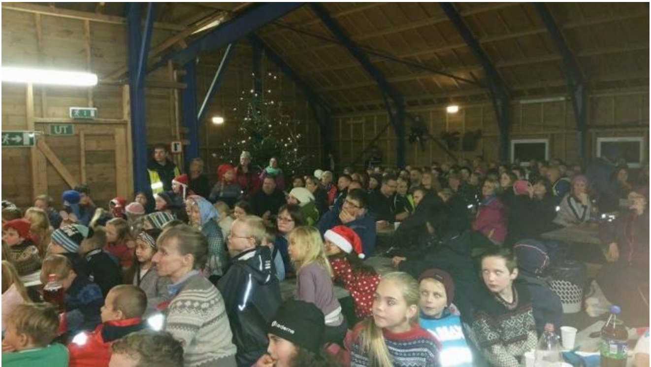
Masse folk i Dønhauglåven.

Tekst og nett: Thor Inge Døssland