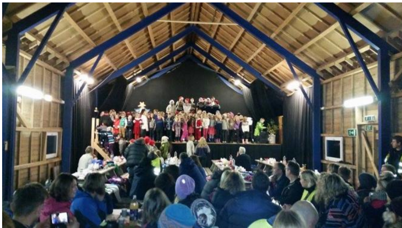
Alle elevane på scenen i Dønhauglåven.

Uskedal skule har dei seinare åre hatt ulike variantar når dei har hatt julefest. Årets fest var i kveld, og då var det oppmøte ved bensinstasjonen på Brekkesletta, og så gjekk dei i tog med lys og lyfter til Dønhauglåven. Der fortsette festen med program der elevane i alle klassane presenterte flotte juleinnslag.