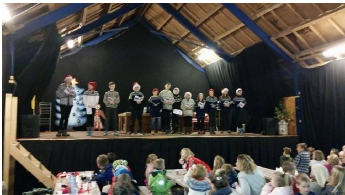
7.klasse les sjølvskrivne dikt.