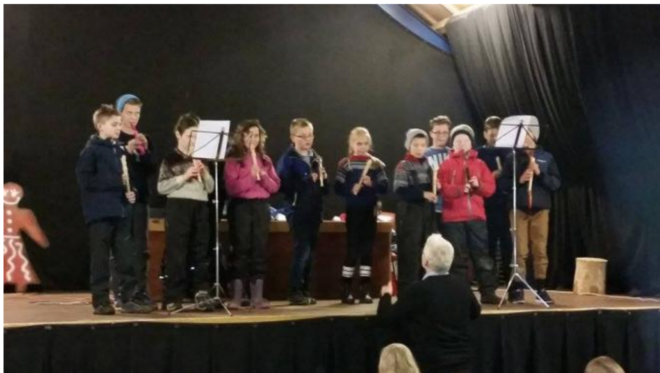
Flott blokkfløytespel og sang av 5.klasse.