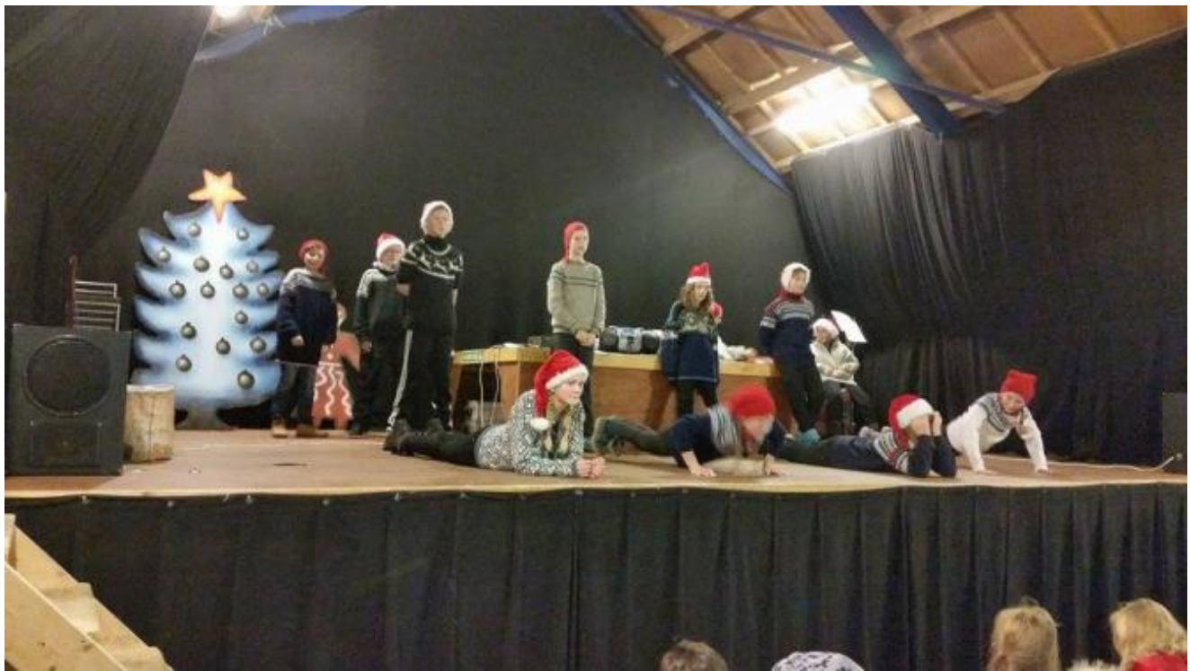
7.klasse bidrog også med dans.