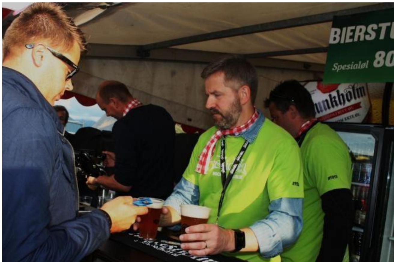
ÅRETS NORSKE ØL HEVDA SEG BRA OG HER VERT DET SELD AV MOEN FRÅ IJOSNES Tekst, foto og nett. Ola Matti Mathisen