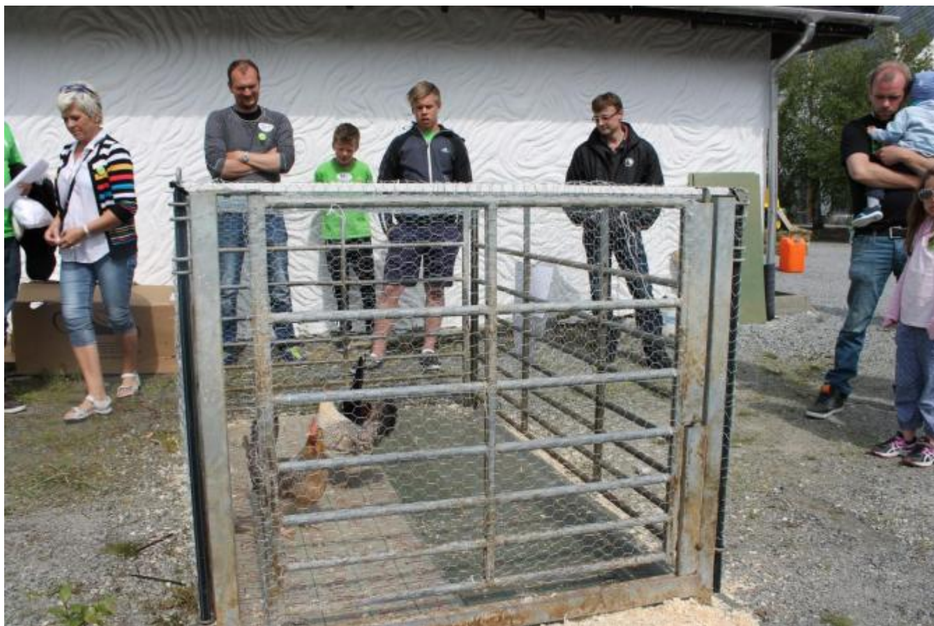
Dei venter på at hanen eller hønene skal avgjera tevlinga!

Høneskittbingoen kom til erstatning for kuskitbingoen og hadde ein hane og 2 høner av uvisse raser som aktørar. Arrangøren hadde ingen erfaring med denne originale konkurranseformen, men den var vellukka. Høna avgjorde tevlinga etter eit kvarter!