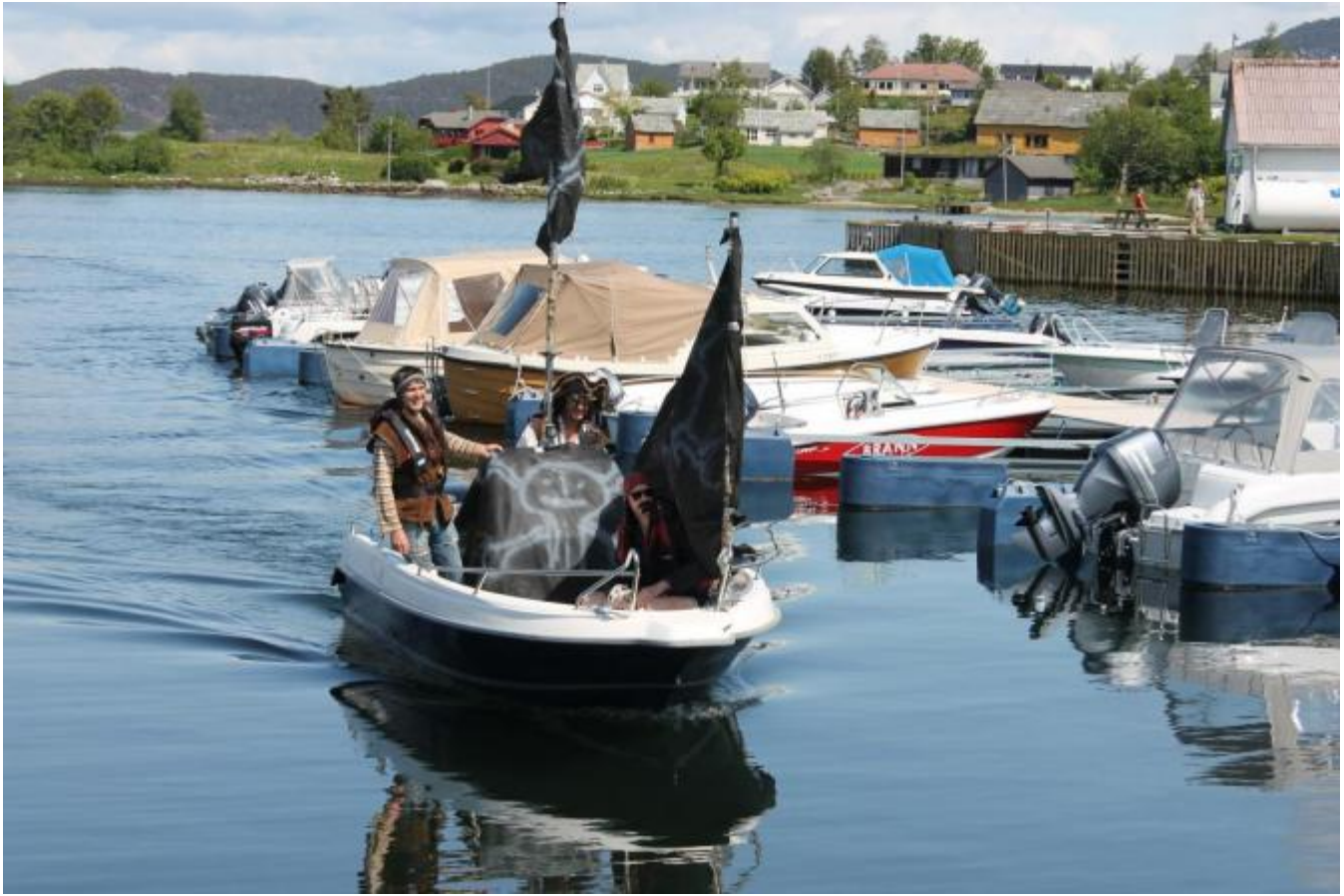
Sprødere for kvart år!