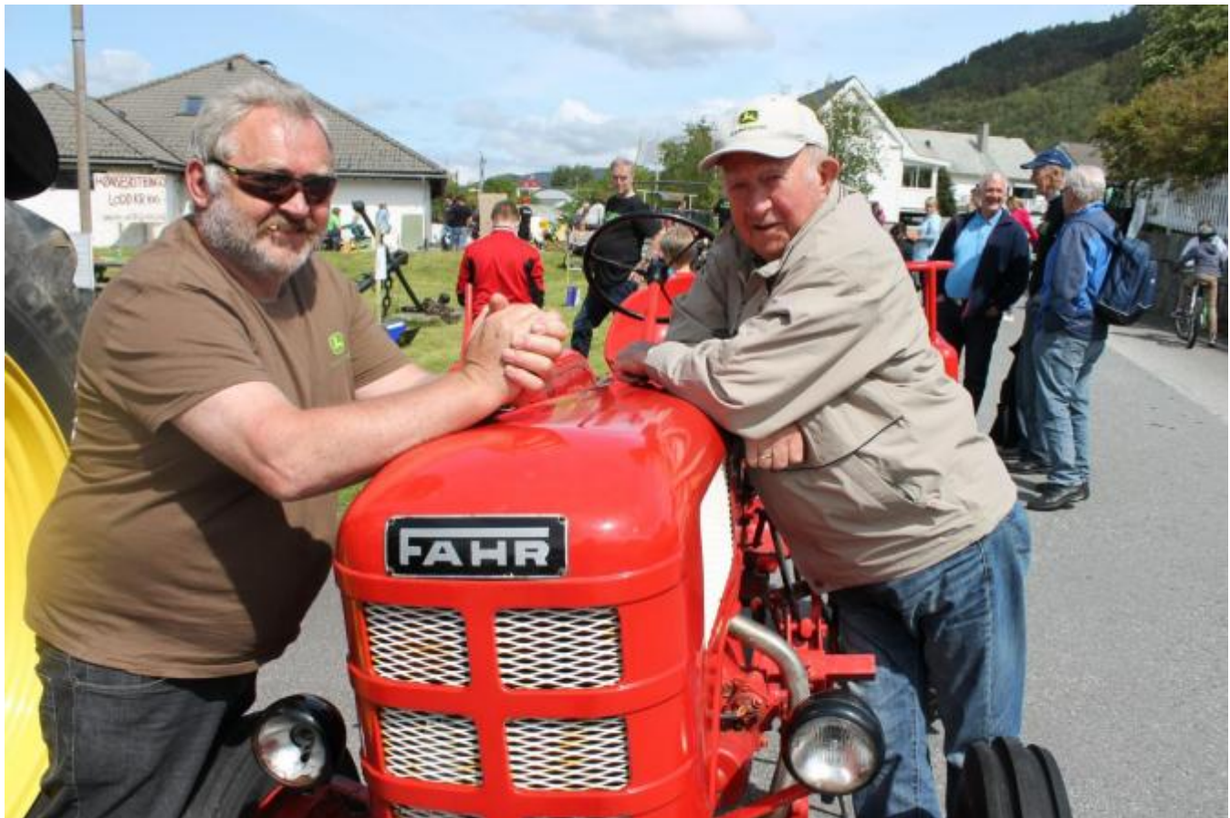
FAR OG SØNN MED FAHR