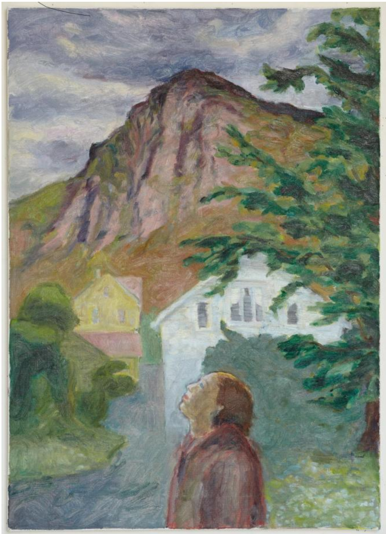
OVERSKYA, tempera og olje på lerret.