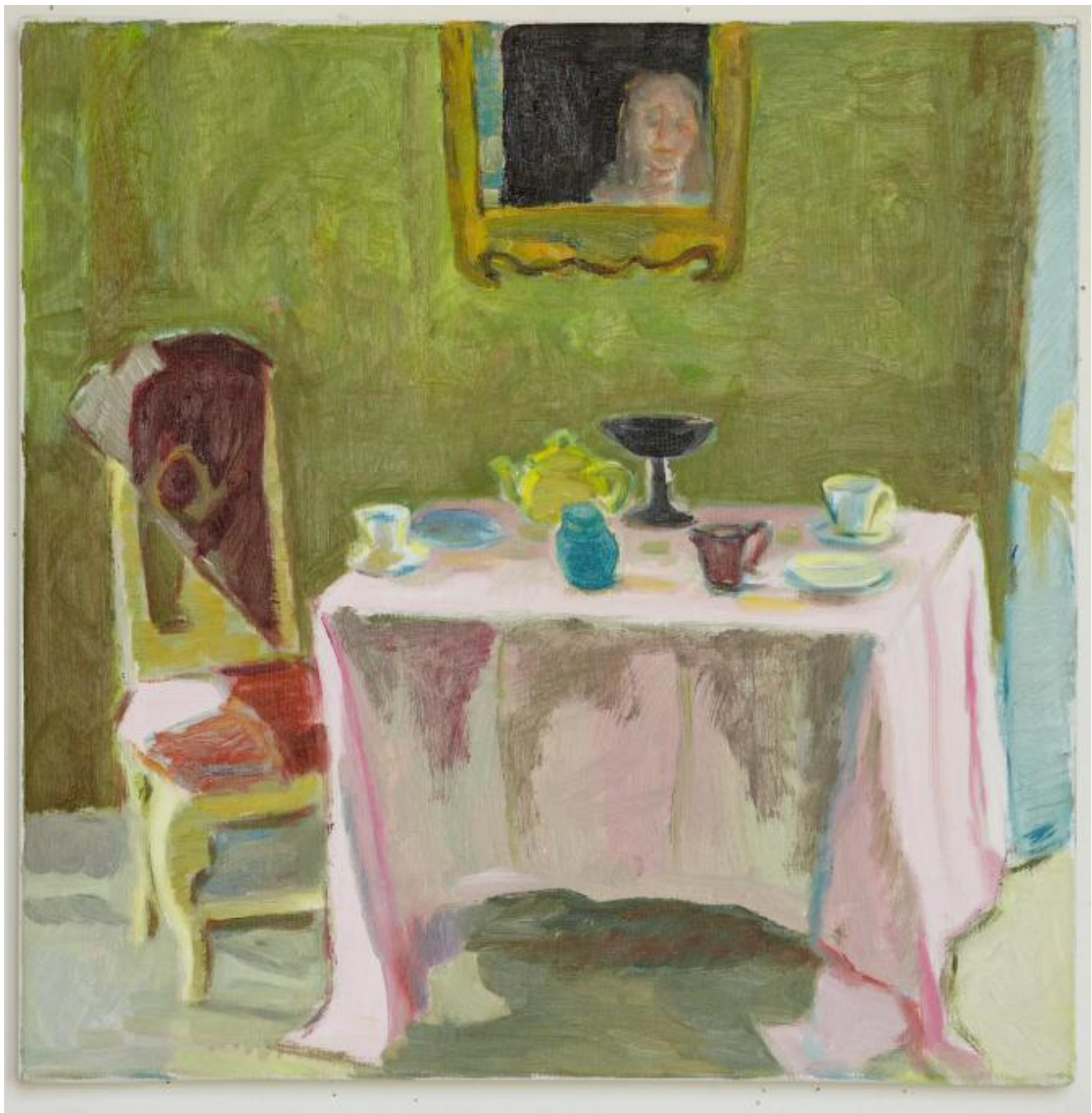
ROSA DUK, olje på lerret.