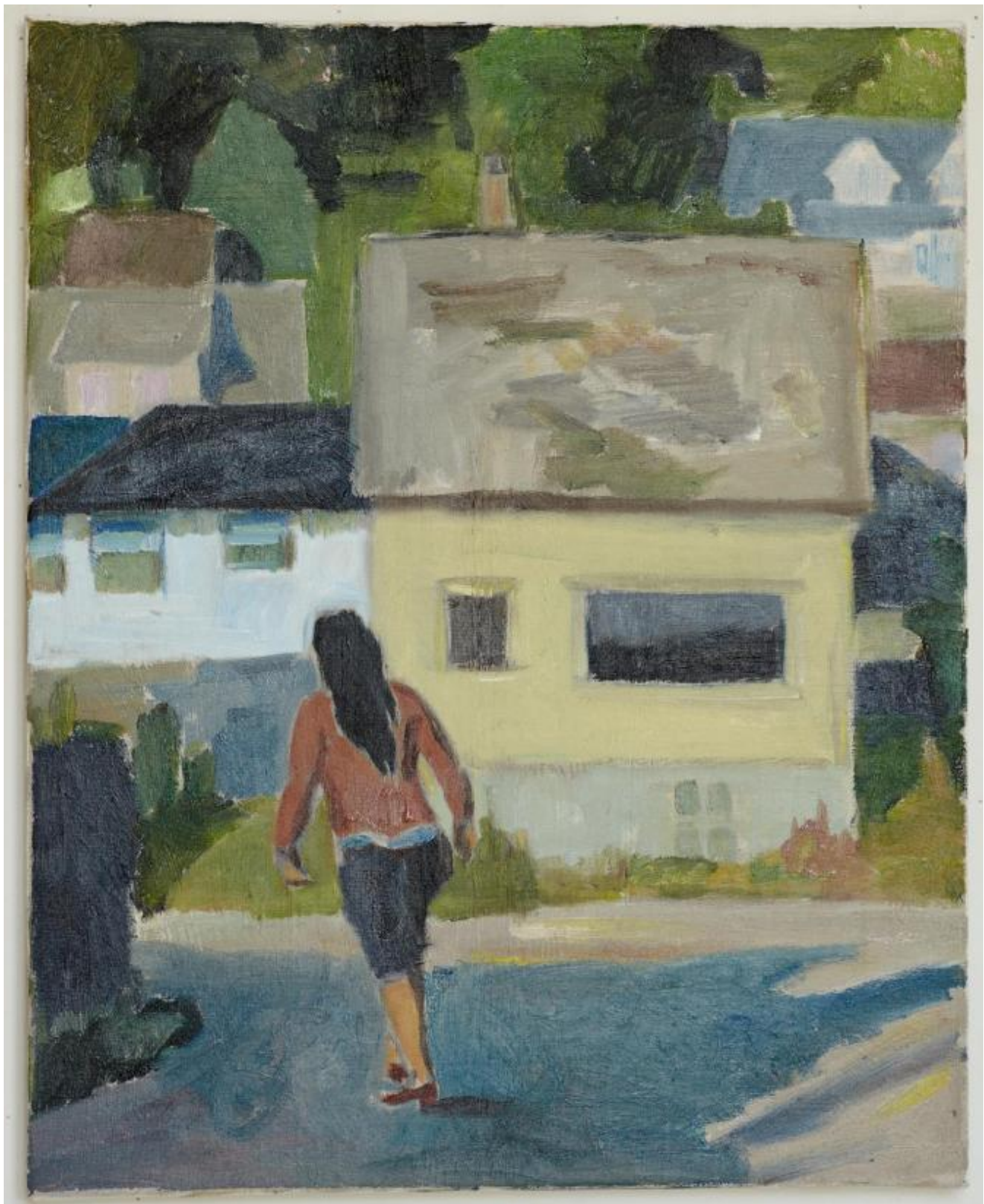
PÅ TUR I VAKSDAL, olje på lerret.