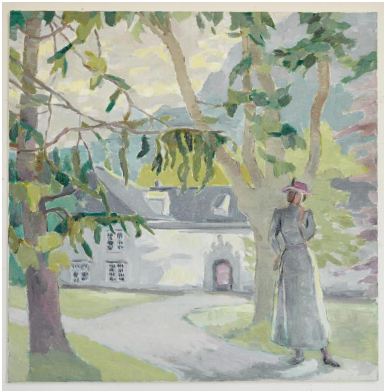
PORT OG DAME, olje på lerret