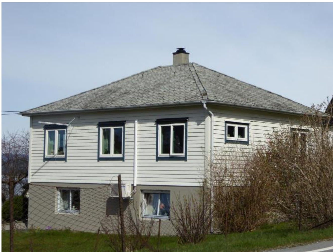
Frå dette huset vart motstandsarbeidet organisert

Sidan det i desse dagar er 75 år sidan krigshandlingane i Uskedalen og Herøysundet, 17.-20.april 1940, er det tid for å stoppa opp for eit kort tilbakeblikk. Kampane som føregjekk her desse uhyggelege april dagane, var nok kraftigare og meir heftige enn vi er klar over i dag.