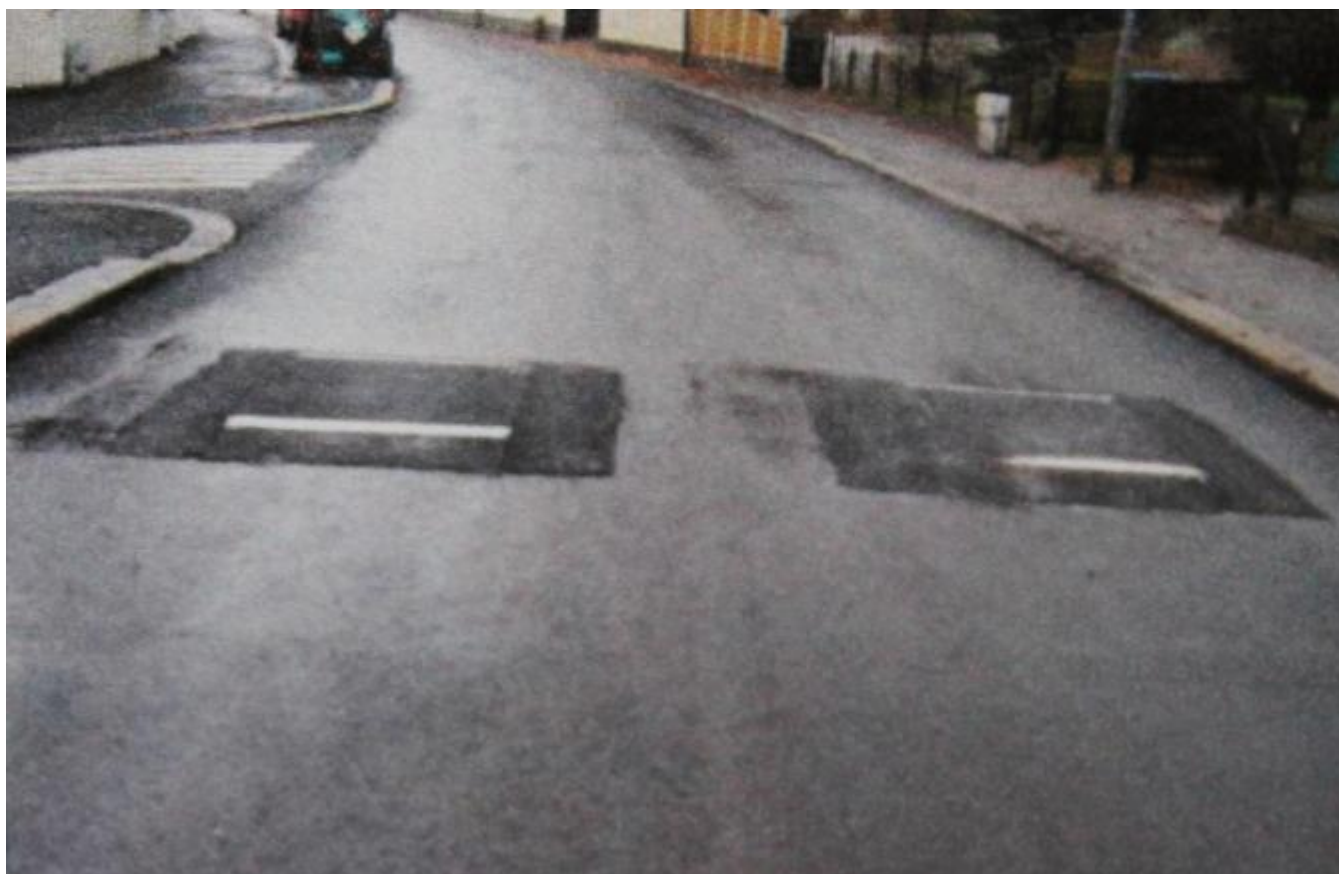
Fartsputar like etter dei var innført men før snøen kom

Under trafikkøtet i skulen onsdag var det mykje snakk om fartsputar og nokon av dei frammøtte gjekk inn for slike som fartsreducerande tiltak. Men mange visste ikkje kva det eigentleg er. Difor skal vi her gjera ein stutt visitt i Lillehammer, som har satsa på dette og har gode erfaringar. Grunnen til at det vart innført der var at fartsnivået i enkelte gater var altfor høgt, og målsettinga var å få det ned til 30 kilometer, som er vegvesenets kriterium for byar og tettbygde område.. Eit tiltak som inngjekk i prosjektet var å innsnevra gateprofilane både i samband med kryss og mellom desse. I samband med innsnevringane vart det også planta tre for å mildna det 'harde' inntrykket.