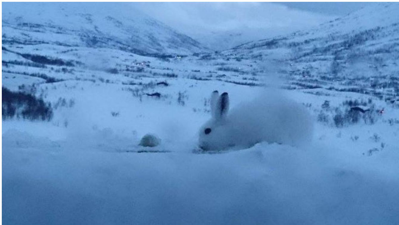
Påskeharen på besøk.

Vi har fått svært mange kjekke tilbakemeldingar på spalta vår lesarbilete som vi byrja med i januar i år. God respons frå lesarane er grunnen til at spalta er blitt så bra. Vel 60 bilete frå 17 innsendarar er lagt ut til no. For tida legg vi ut nytt bilete annankvar dag. Det håpar vi at vi kan halda fram med, men det er avhengig av at mange er flinke og senda inn bilete.