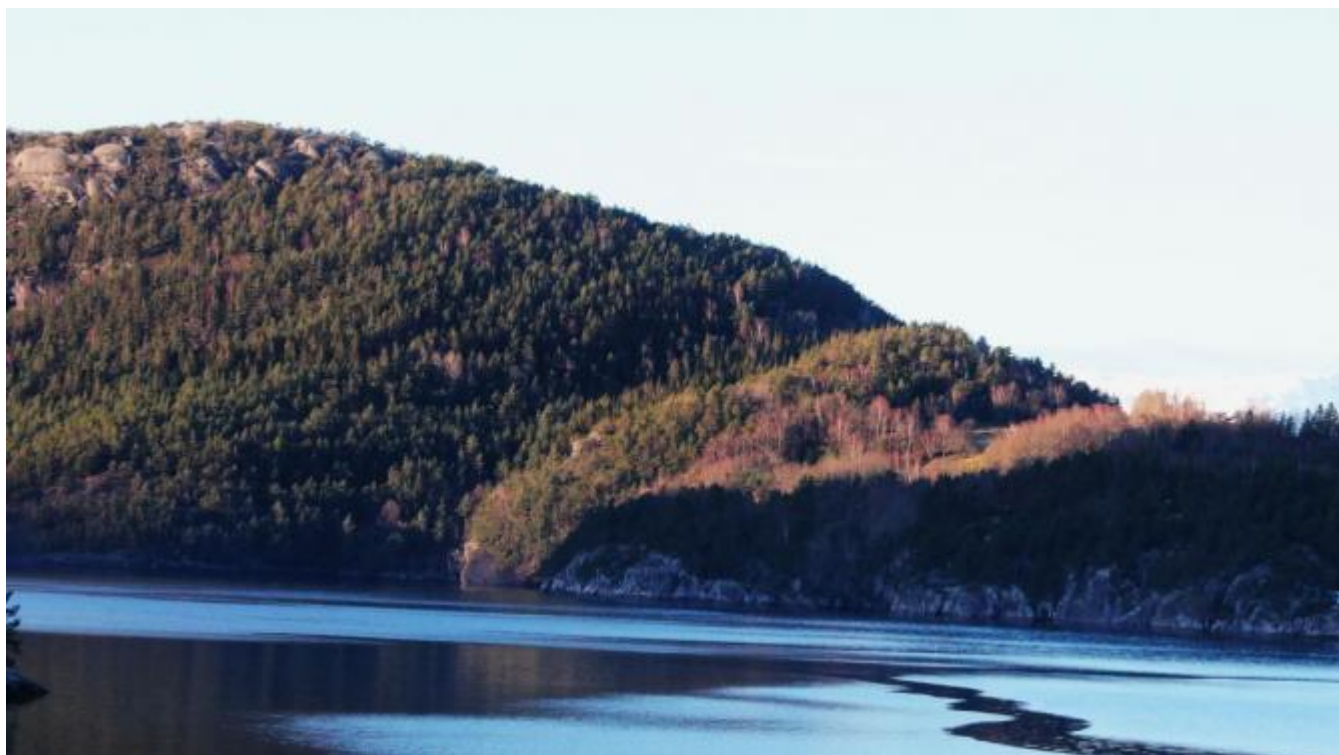
Lovande sol på Skorpo

I dag har vi fått ein lovande opptakt til kva vi har i vente.