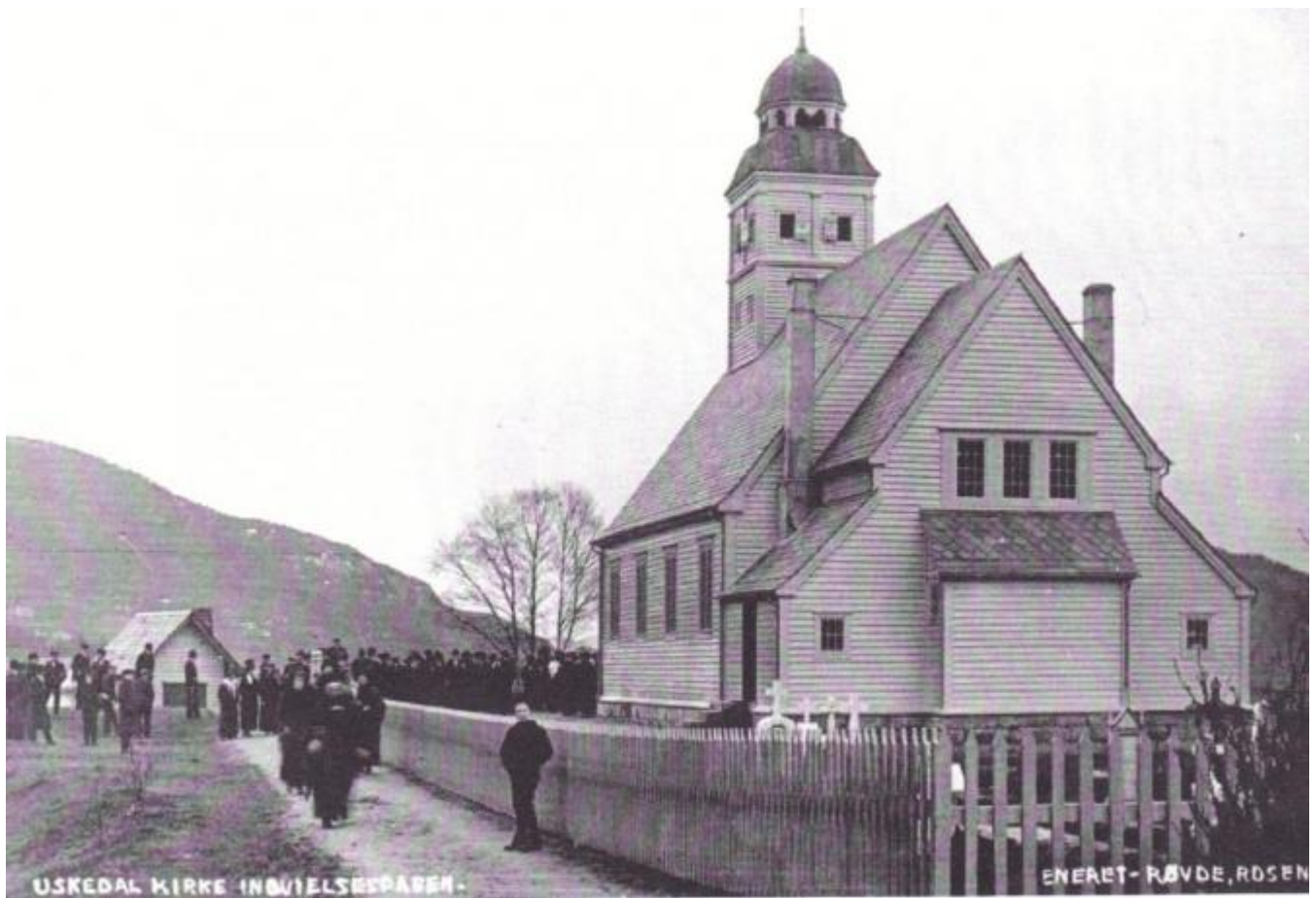
USKEDAL KIRKE INDVIELSESPARER.