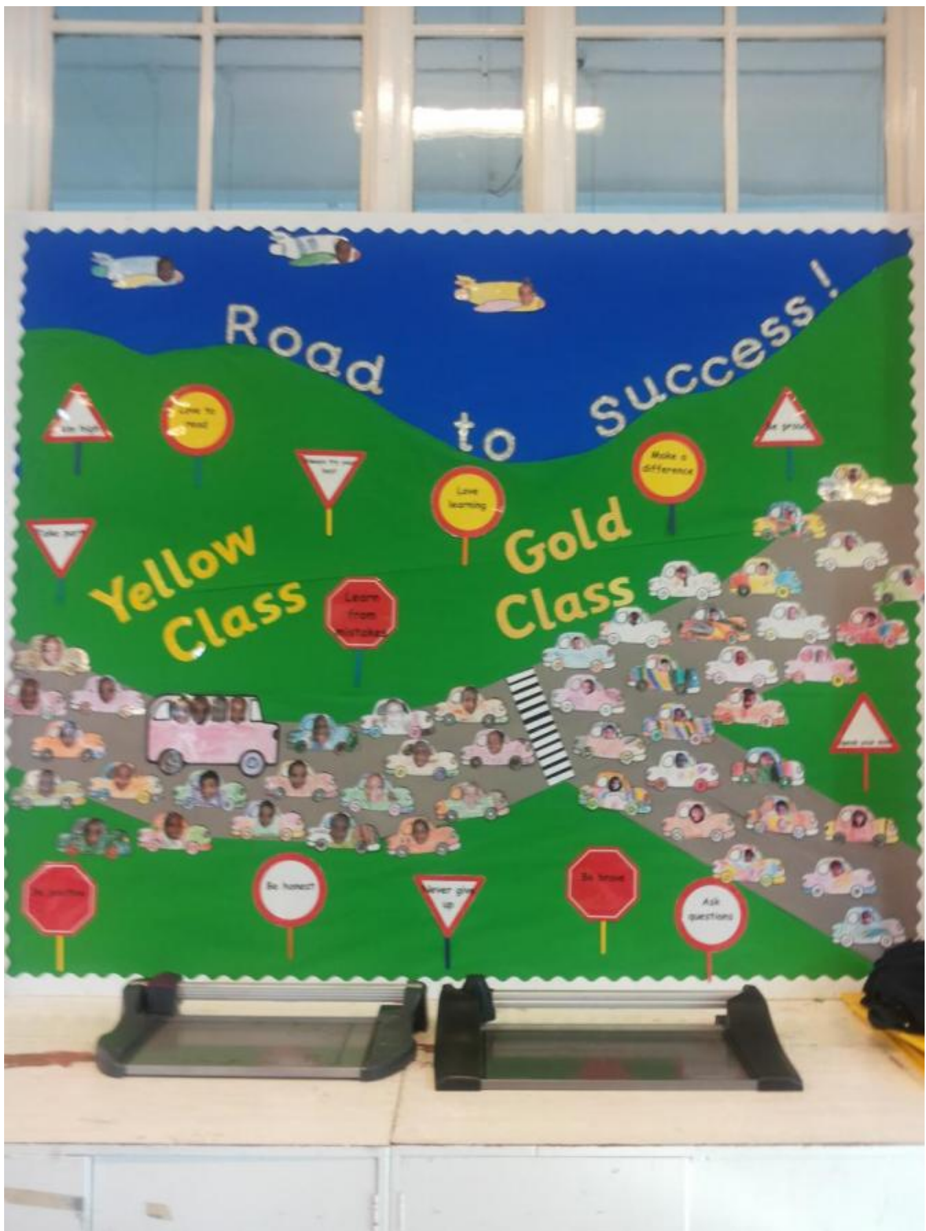
Britane bruker ikkje lærebøker, dei heng lærestoffet på