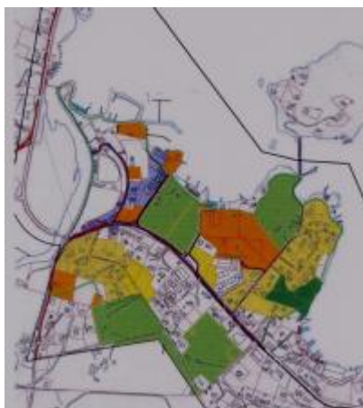
Dette er eit arealkart