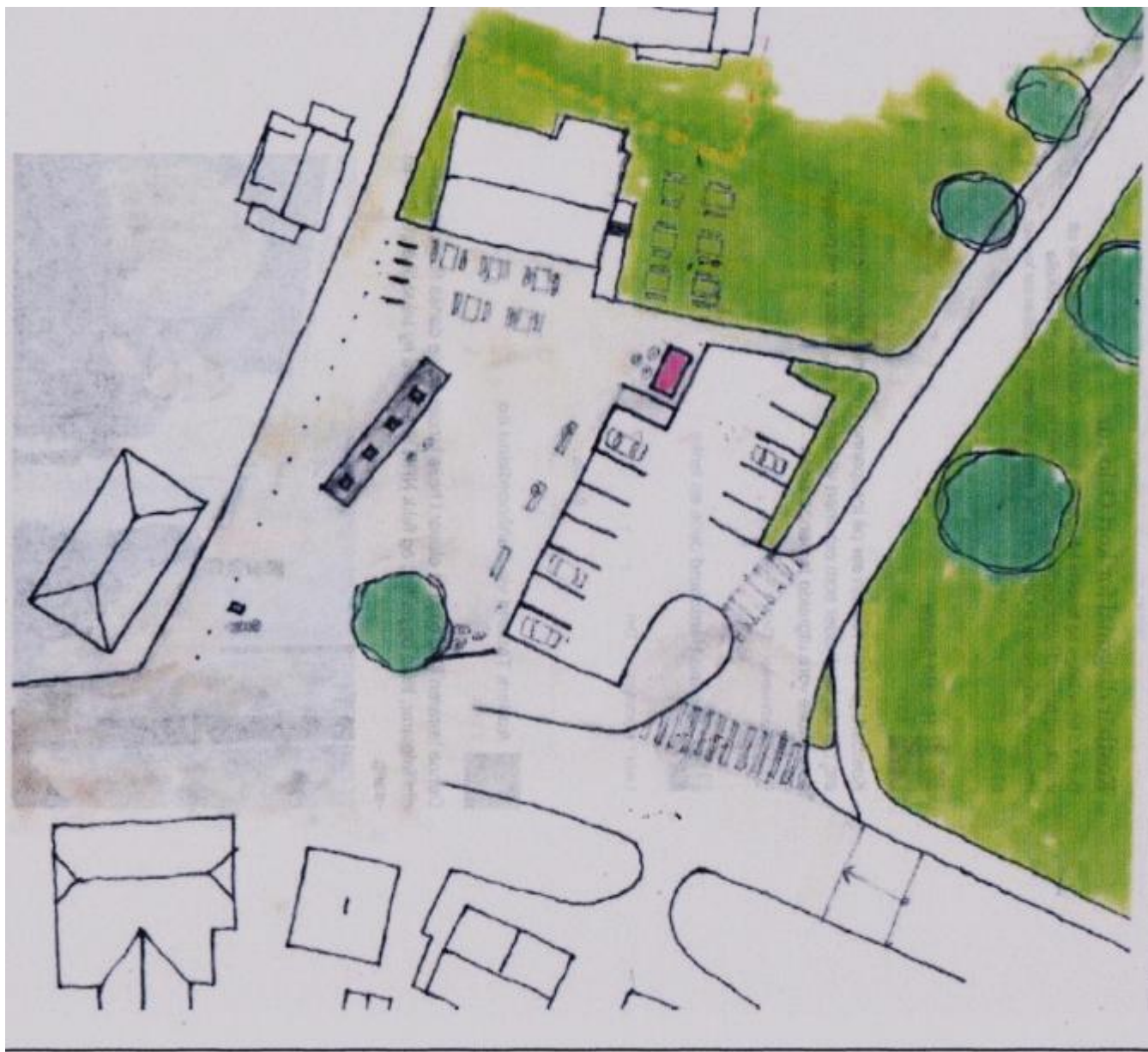
Torget i sentrum tenker planleggjarane seg slik

Om gang og sykkel heiter det at det skal vera fortau langs Sandavegen frå fylkesvegen til sjøen og fortau frå blomebutikken til brua. Vidare skal det vera gang- og sykkelveg frå kyrkja til elva, langs elva vestover og over ny bru på odden.