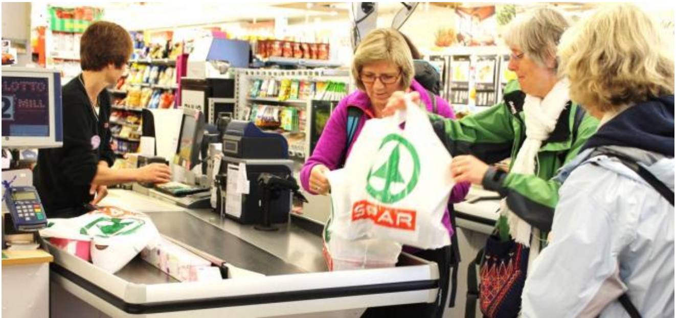
Kundene er tydeleg tilfredse med butikken i Uskedalen

SPAR USKEDALEN har ingen formsvikt. Også i år toppar dei kundeundersøkinga som vart gjennomført i april og som omfattar 300 husstandar. Ei slik undersøking har no gått føre seg i 8 år og suksess-butikken her har gått til topps i 6 av dei.