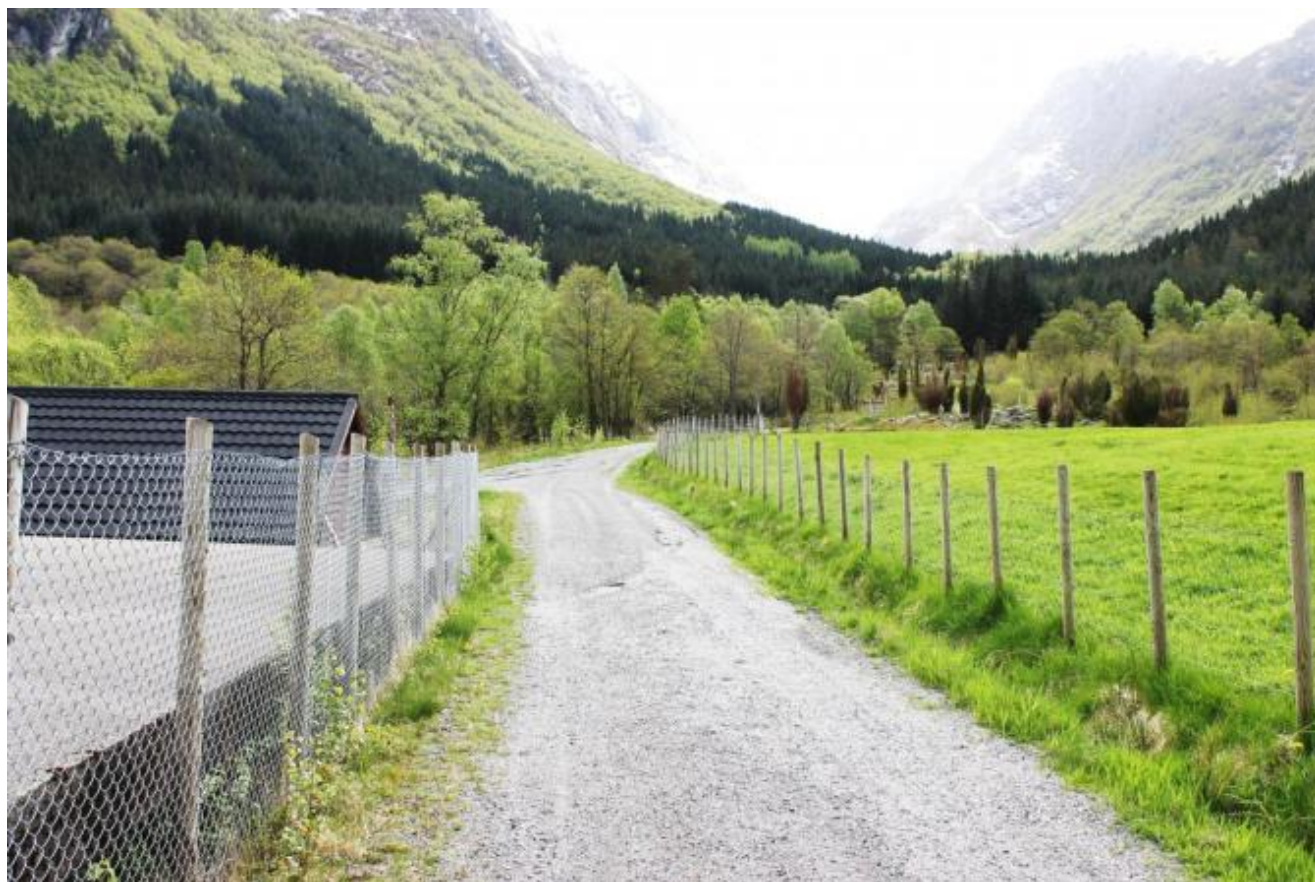
Aust eller vest er det springande punkt i Eikedalen

Val av austsida eller vestsida av Eikeelva er eit viktig punkt i NVE sin vurdering av søknaden om utbyggjing og kanskje avgjerande for om det vert noko av prosjektet. NVE peikar på at tiltaket berører ein mykje brukt T-merka innfartsrute til viktige friluftsområde i høg fjell av B-verdi. NVE meiner friluftslivet i stor grad vil bli påverka om tiltaket leggjast på vestsida av elva ved eller i turstien