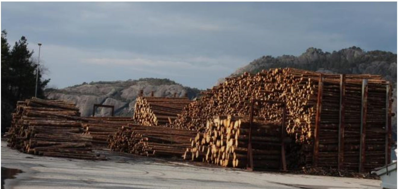
No er det tømmerhogst igang også i Uskedalen, nærare bestemt i Kjærlandslio og det ber lageret på Børnes kai preg av.