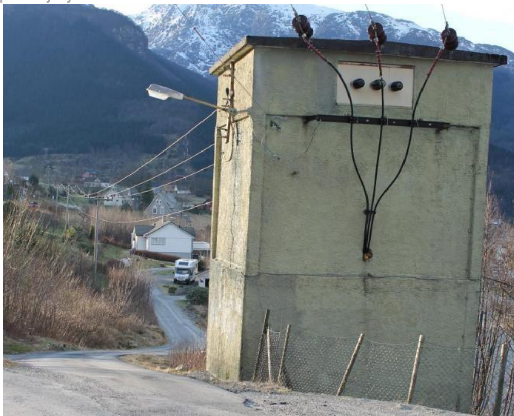
Luftlinja fram hit blir truleg fjerna til våren