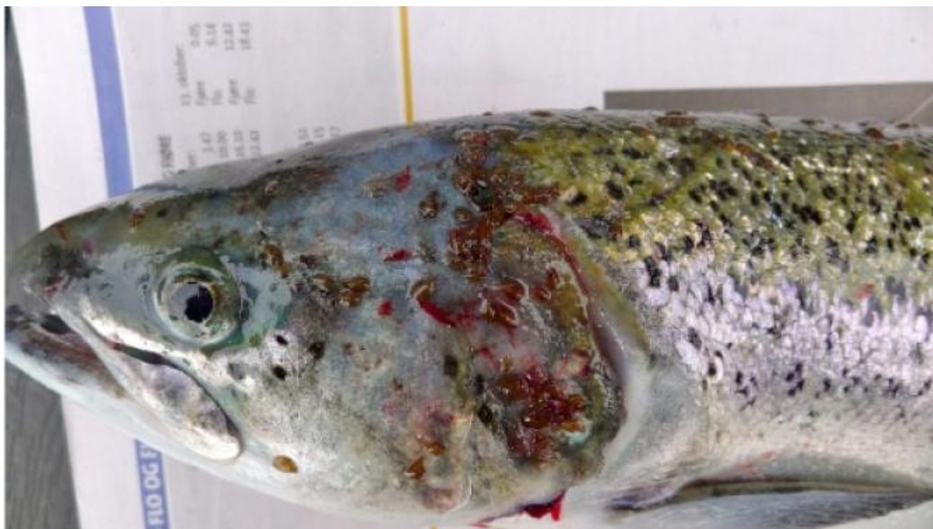
Lusangrep på fisk i distriktet

Svein I. Opdal går inn for at kommunestyret skal seia nei til den føreslegne utviding av Sjøtroll Havbruk sitt anlegg utanfor Skorpo. frå 3120 tonn til 5460 tonn biomasse.