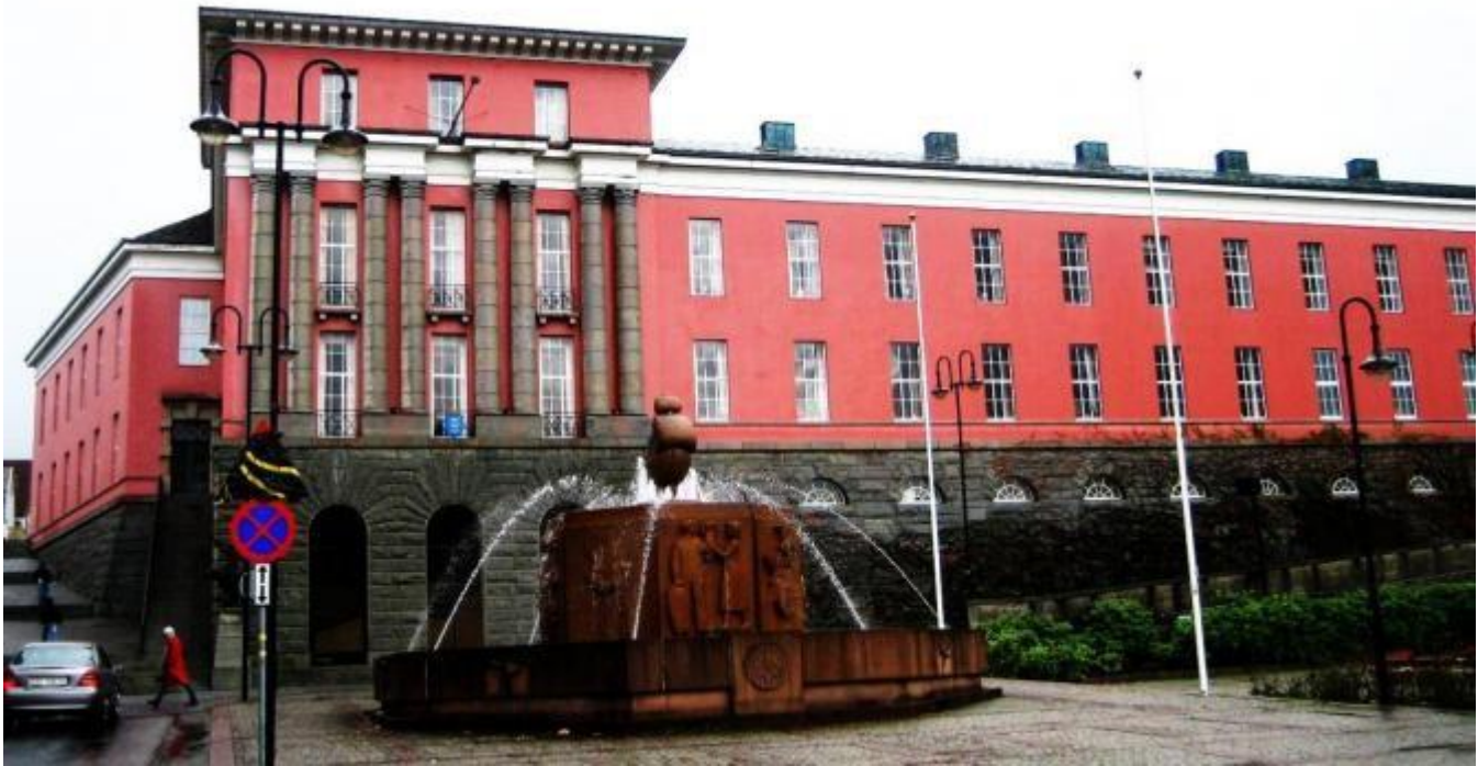
Her skal Røysterett for alle syngja søndag

Koret Røysterett for alle har eit svært smigrande oppdrag klokka 14 søndag. Då har kvinnheringane minikonsert i Haugesunds rosa rådhus som i 2010 vart kåra til det finaste i landet.