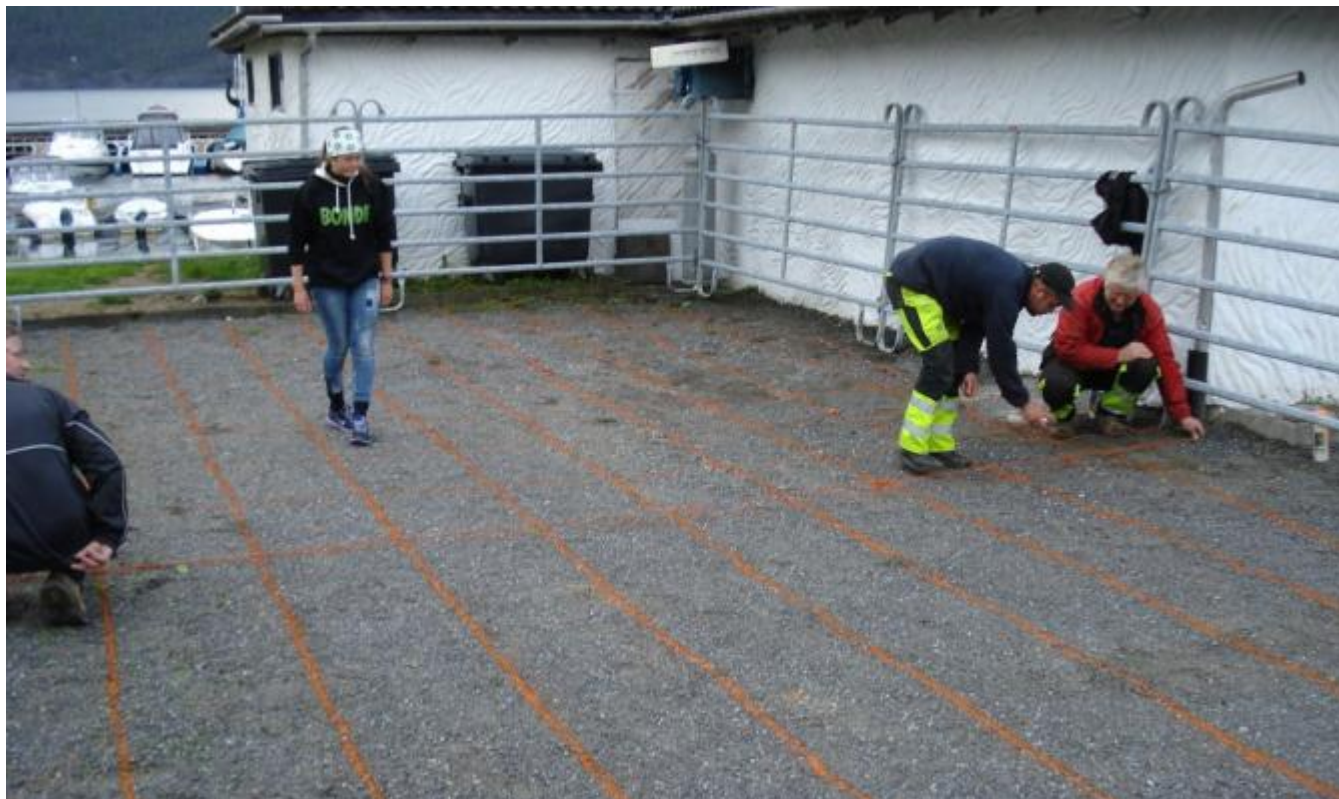
Bondelagsmedlemmer merker og gjer klart til kuskit-bingo