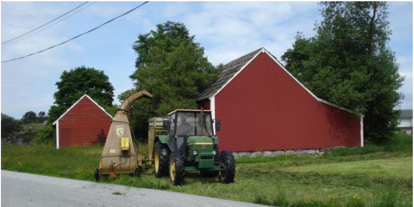
Bjergulv tar seg av noko av slåtten sjølv med John Deer'en sin og forhaustar.