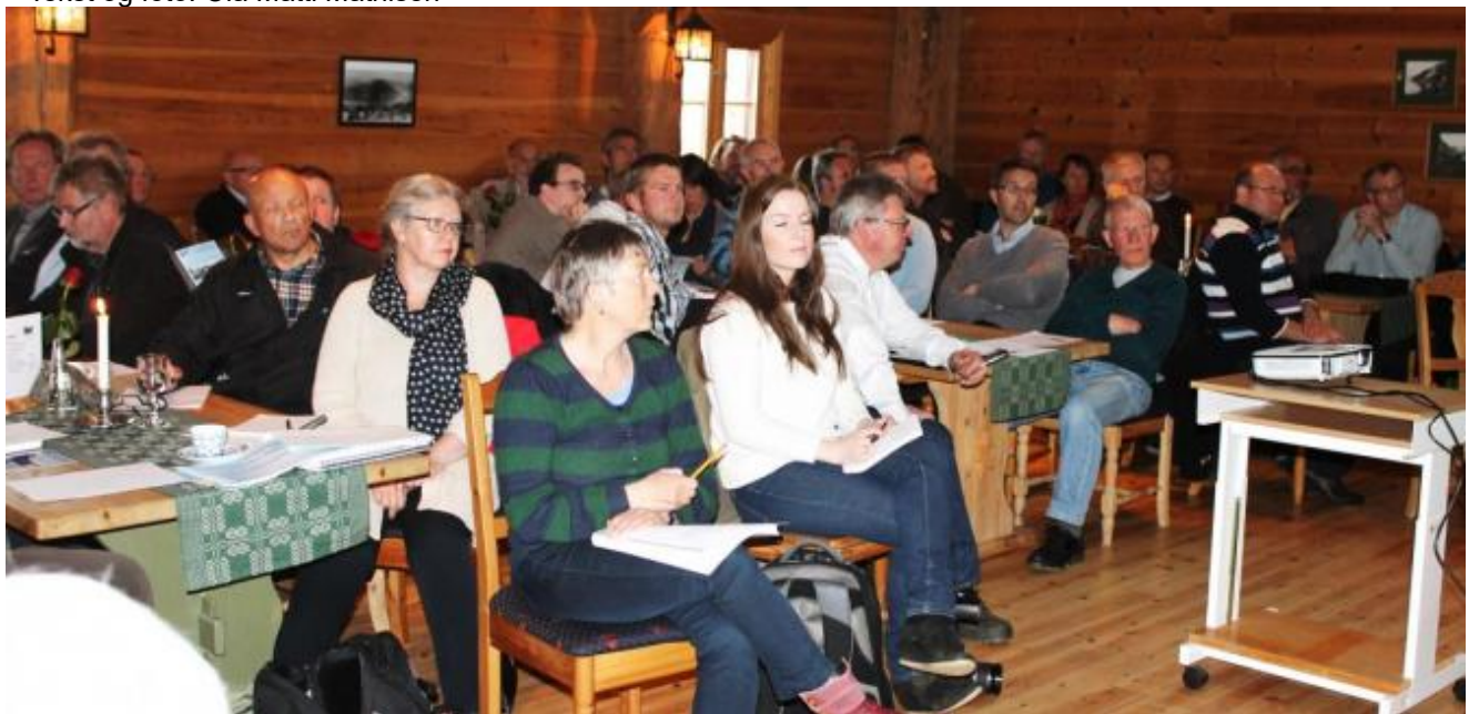
Rundt 60 møte fram i Olaløo