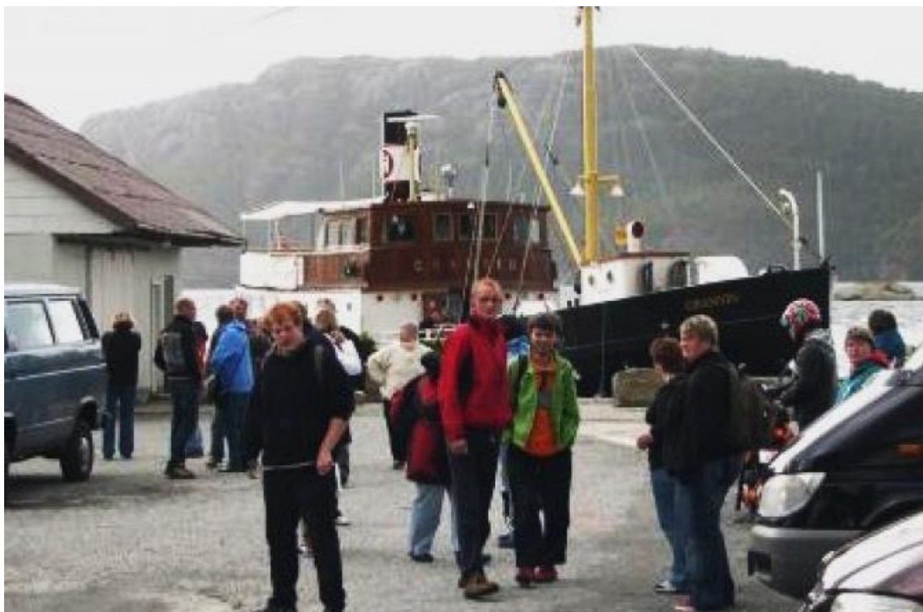
Granvin ved Sandakaien ved eit tidlegare høve.

Det er kjekt å sjå det fine biletet av MS Granvin, teke av Hans Ordin Østebø, skriv Harald Sætre til oss og held fram: