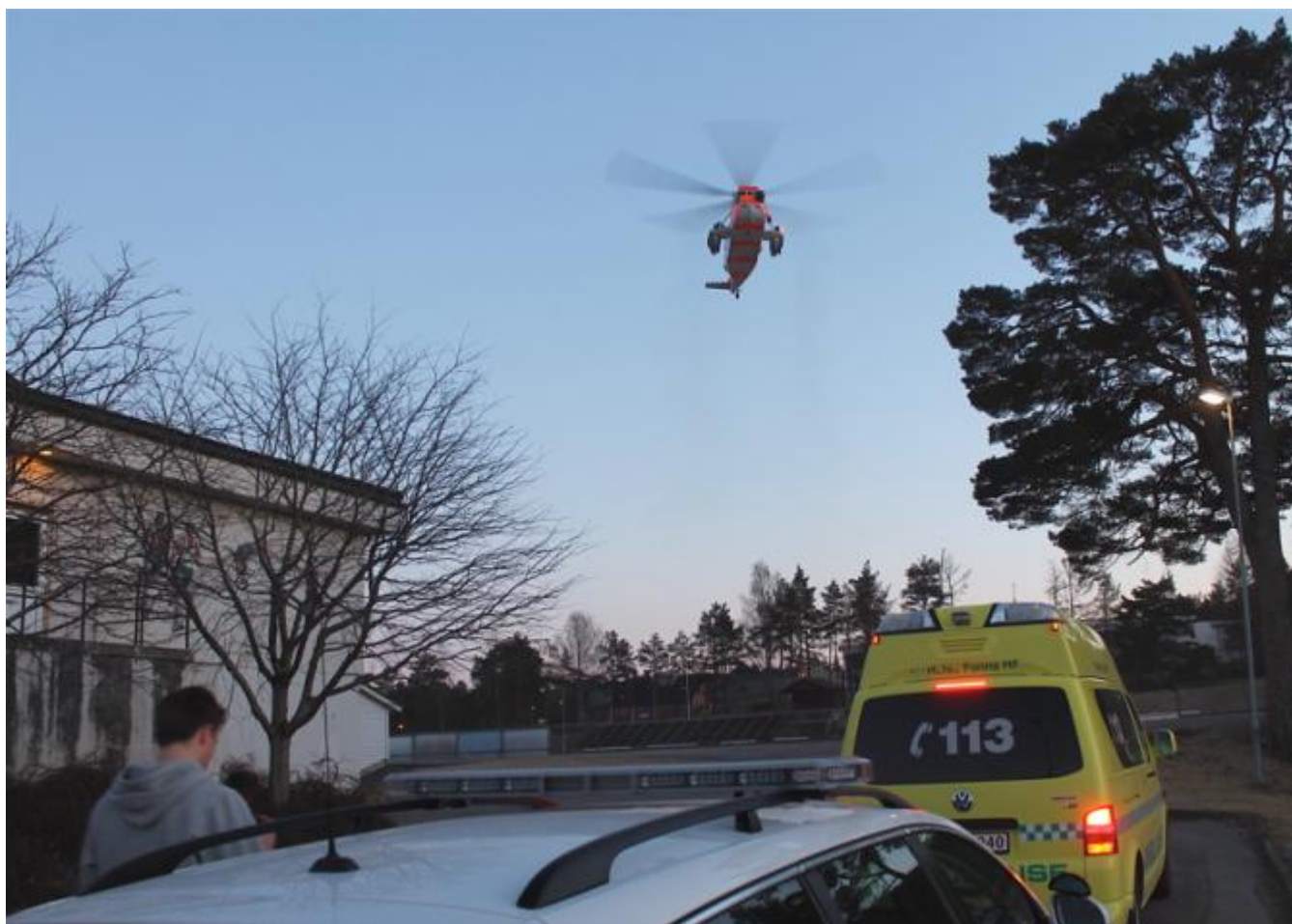
Helikopteret landar på Husnes etter første leiterunde for å ta med ein lokalkjend politimann.

Det vart ved 18-tida sett igang leiteaksjon med helikopter frå Hovudredningssentralen etter ein 36 år gamal litauar som bur på Husnes og som var meldt sakna i området mellom Husnes og Uskedalen.