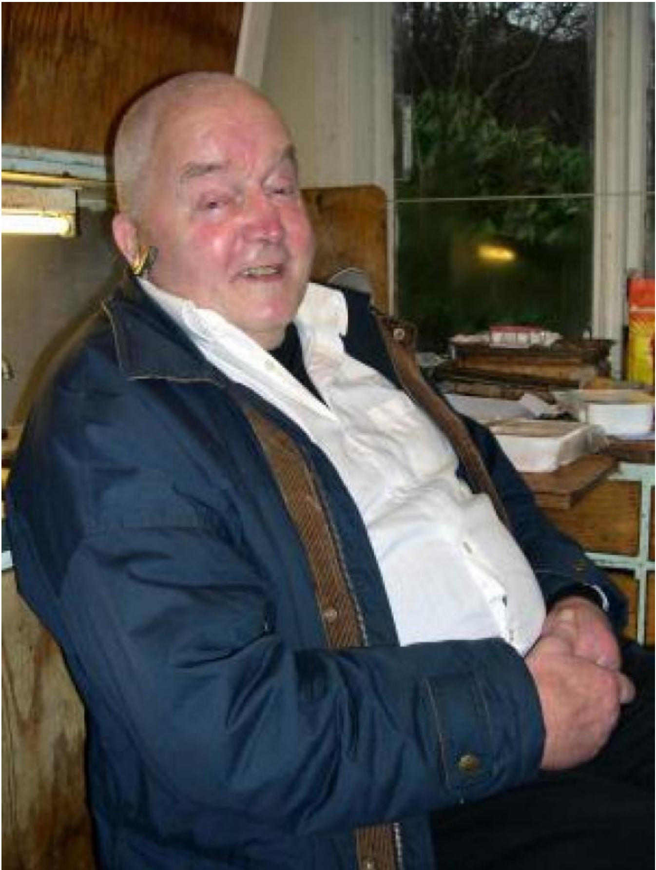
Gustaven var den fremste laksepioneren