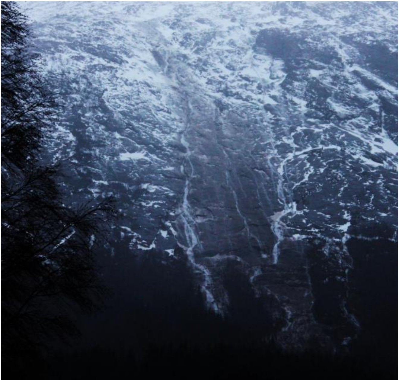
Rasområdet fotografert fra Døssland-gardane

Yr har spådd godt over 100 mm nedbør i inneverande døgn, og så langt kan mykje tyde på at prognosane slår til.