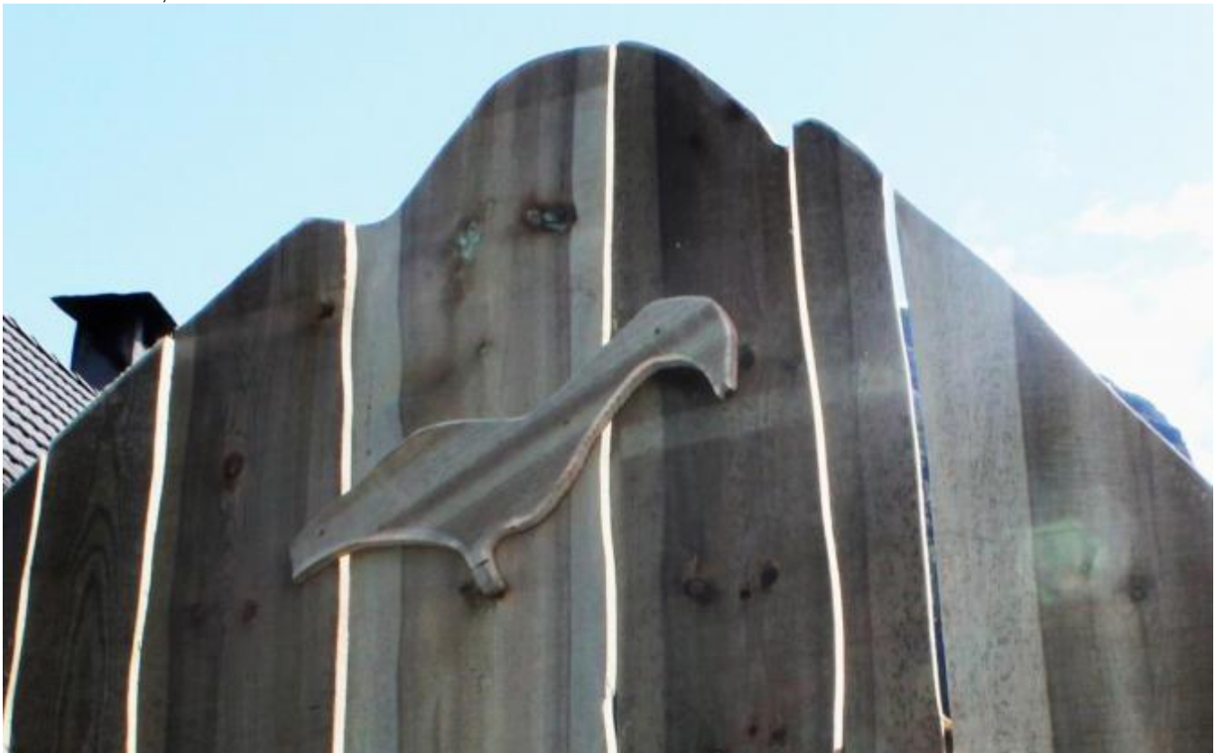
Gåso i Nåsø skal målast kvit

Her er impregnert furu frå Frøland Sag i Vats nytta til eit særst godt føremål og kunstnaren har gjort jobben på 60 timar. Han har levert kunstnarlege produkt til Uskedalen før, men aldri maken til dette.