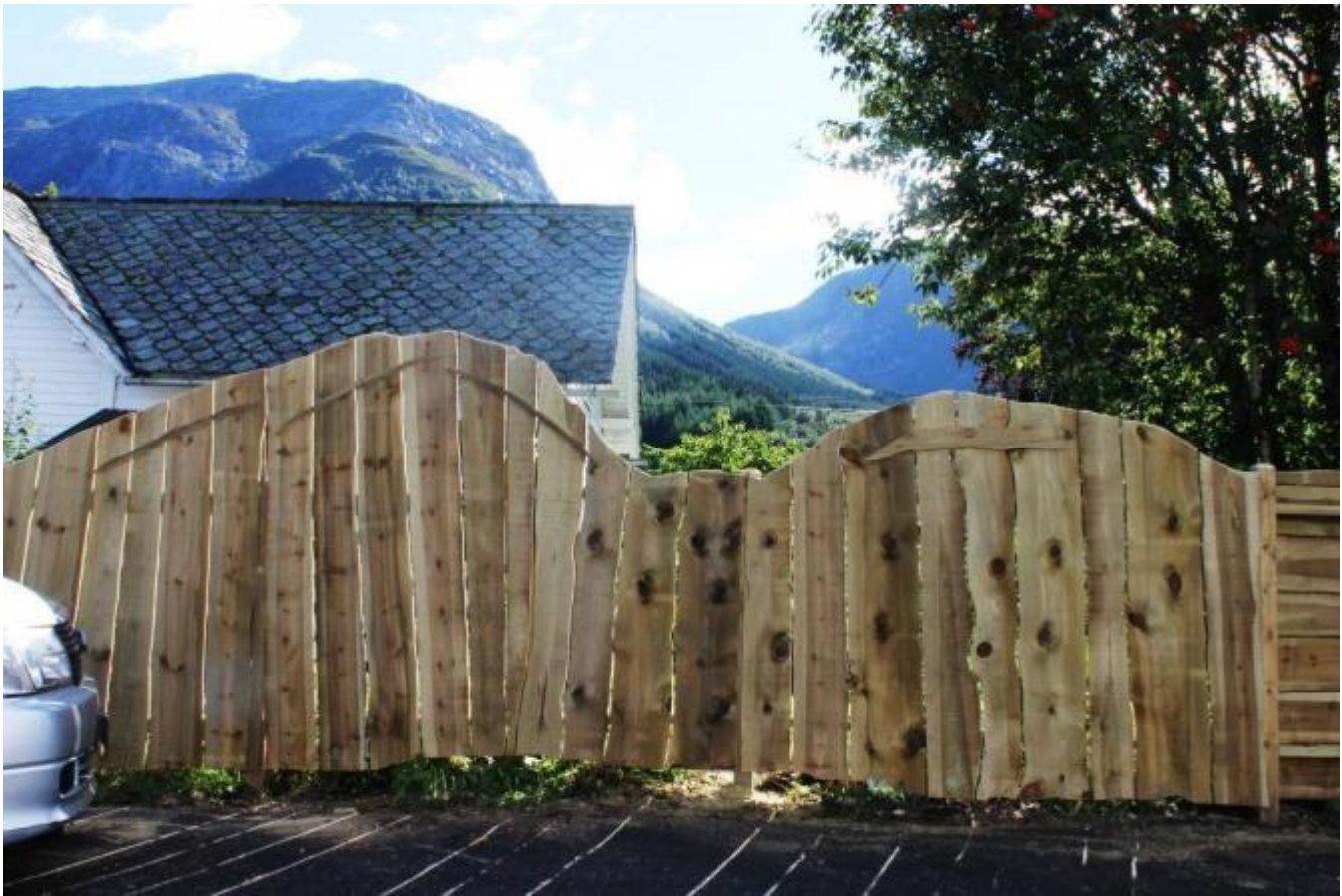
Englafjell og Mannen framfor Englafjell og Mannen

Her er impregnert furu frå Frøland Sag i Vats nytta til eit særst godt føremål og kunstnaren har gjort jobben på 60 timar. Han har levert kunstnarlege produkt til Uskedalen før, men aldri maken til dette.