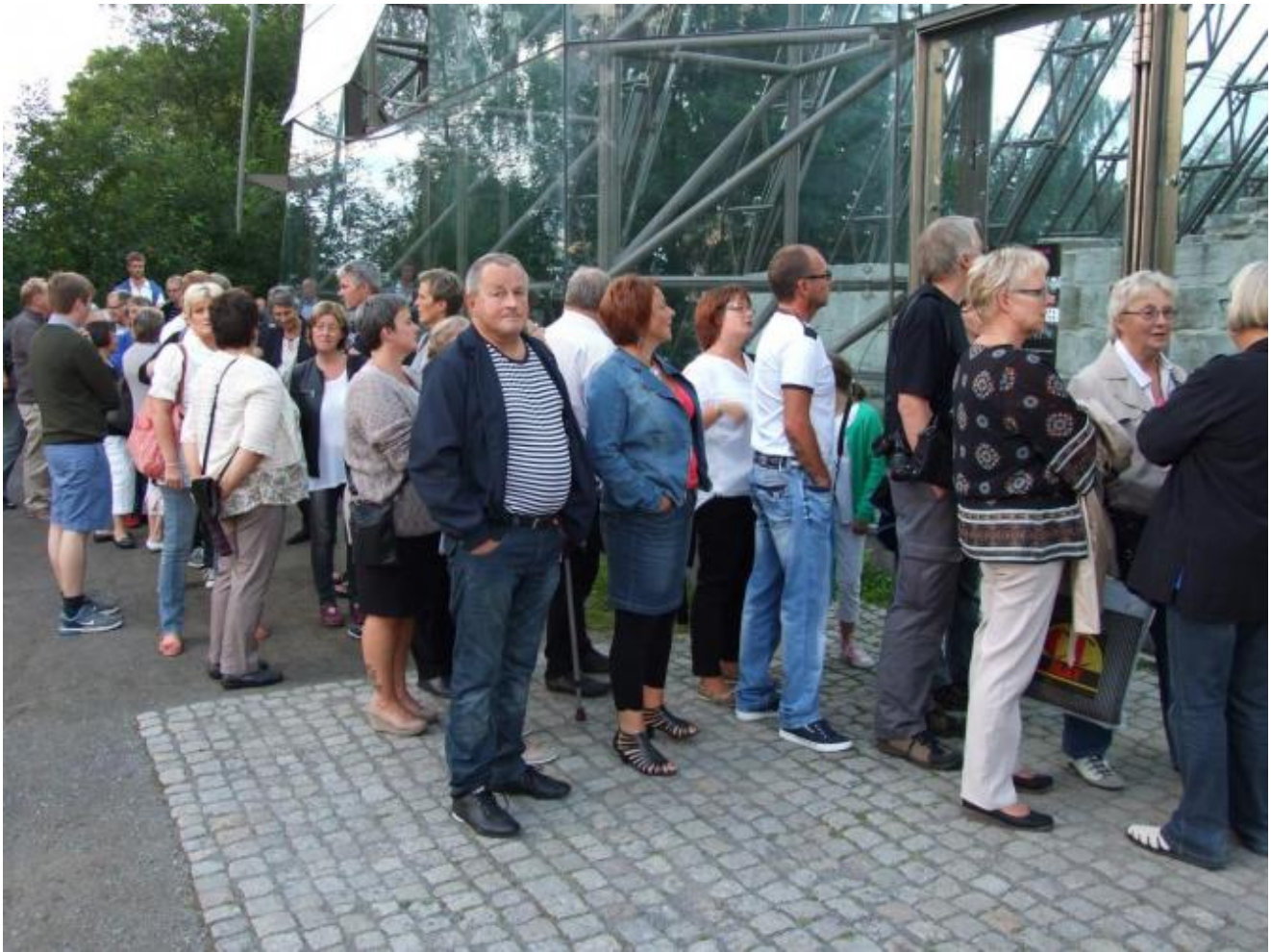
Fremste del av køen 1 time og 10 minutt før konsertstart

Fleire dagar før konserten var alle billettane utselt, og NMF måtte selje ståplass billetter for å stetta den store etterspørselen.