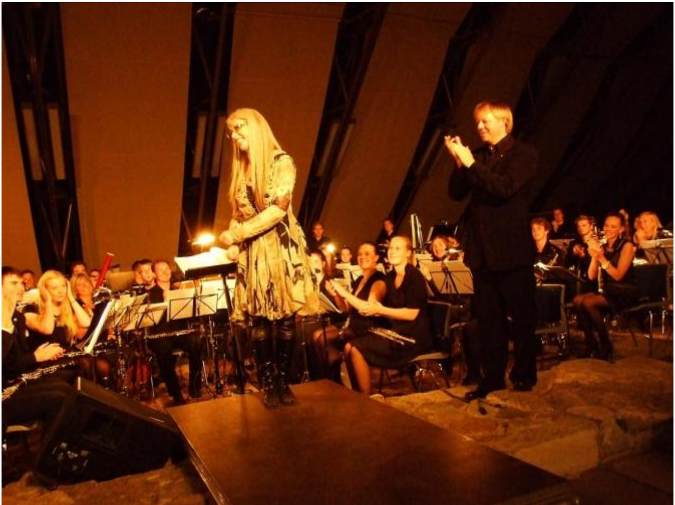
Evelyn Glennie og Ole Edvard Antonsen framfor Norsk Blåseorkester

Norsk Blåseorkester (NBO) og Ole Edvard Antonsen heva seg ytterligare på konserten i Hamardomen fredag kveld.