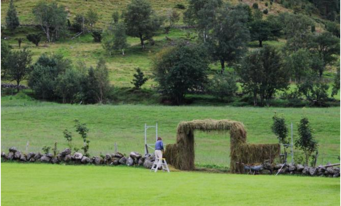
Fin port i eit mjukt landskap