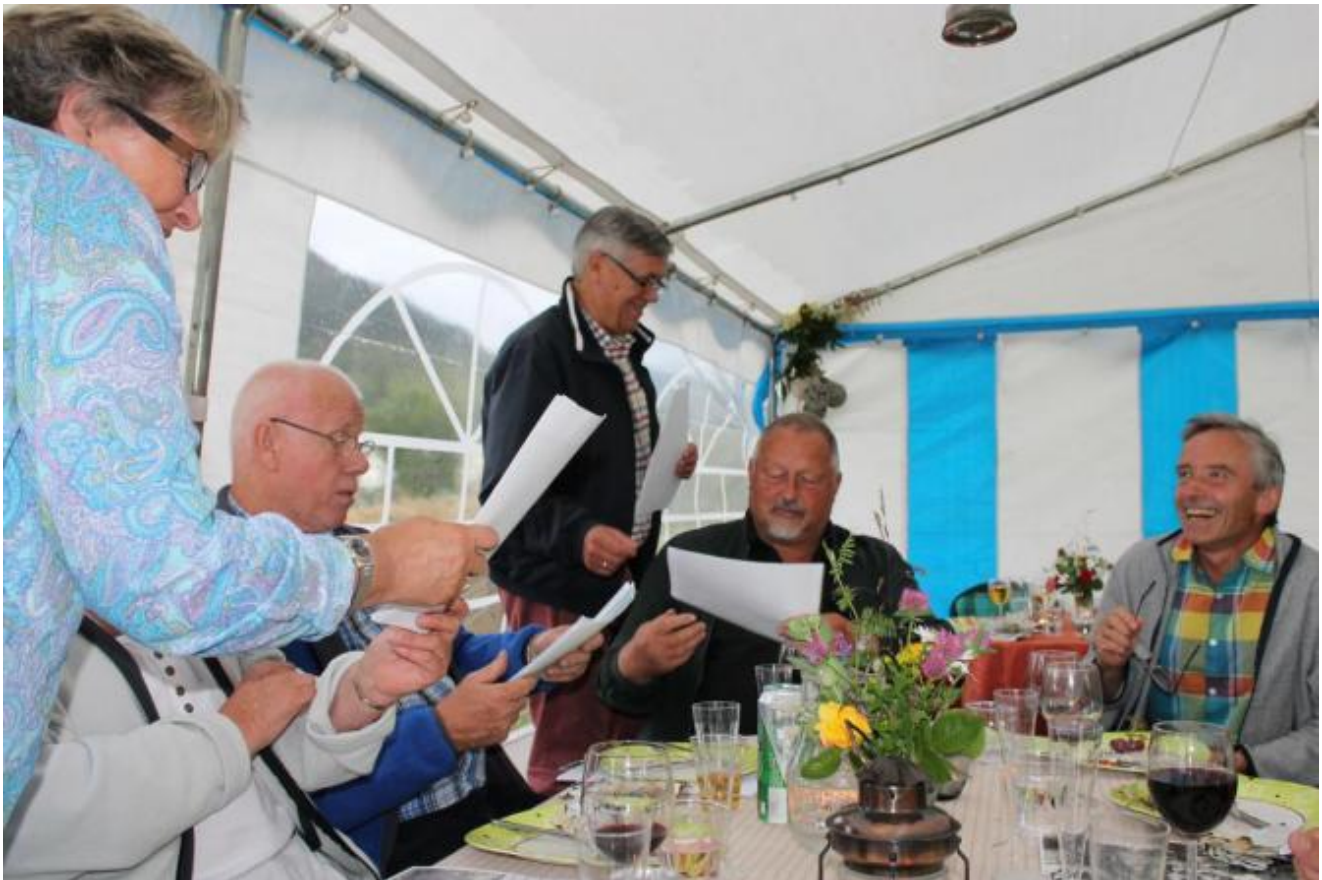
Mange gode minner vart kalla fram av gamle bilete