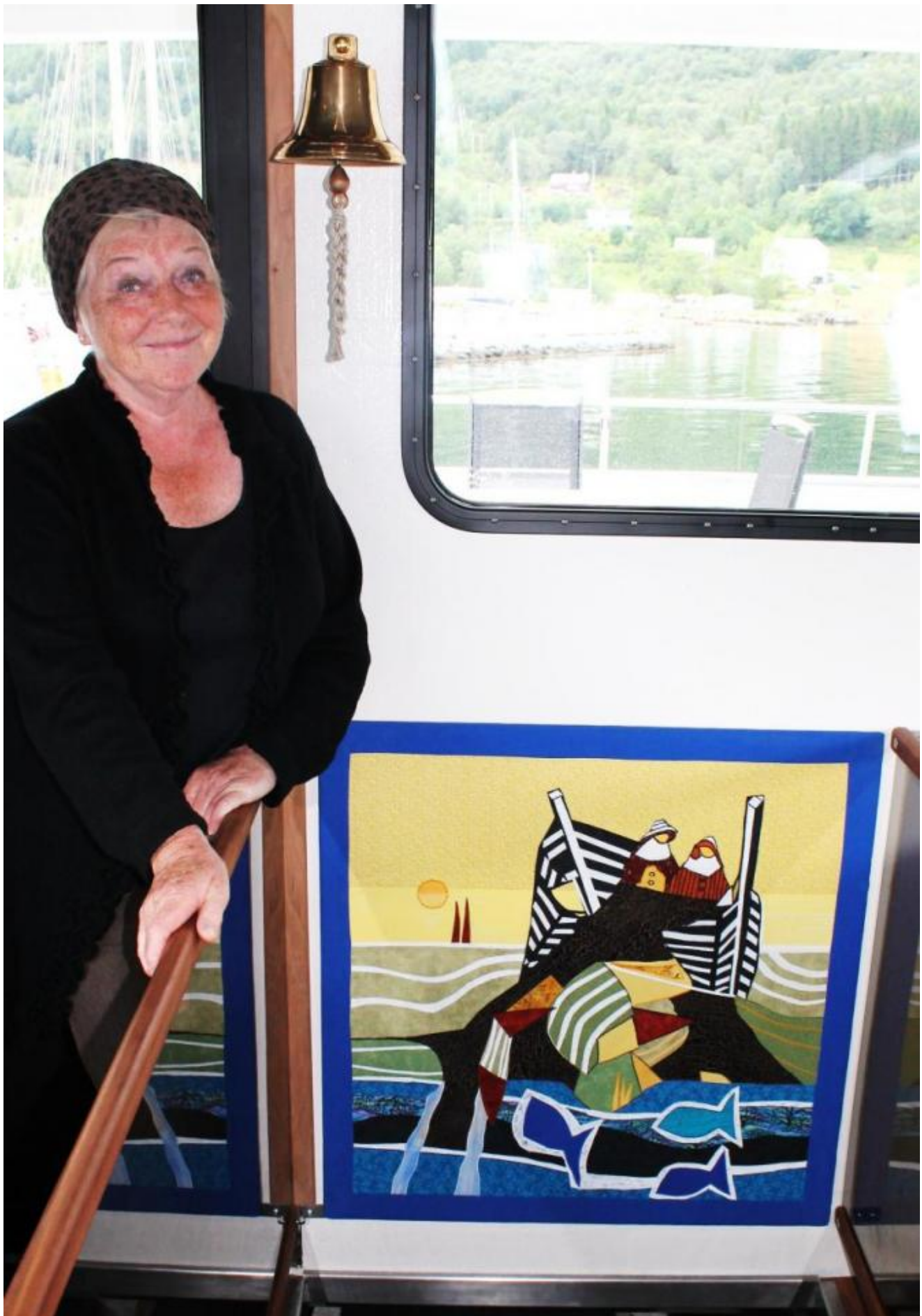
Sigbrit presenterer ein maritim dekorasjon ho har laga til båten

I fjor vart Rabbetausa produsert som den første båt og Undertun kallar henne unik.