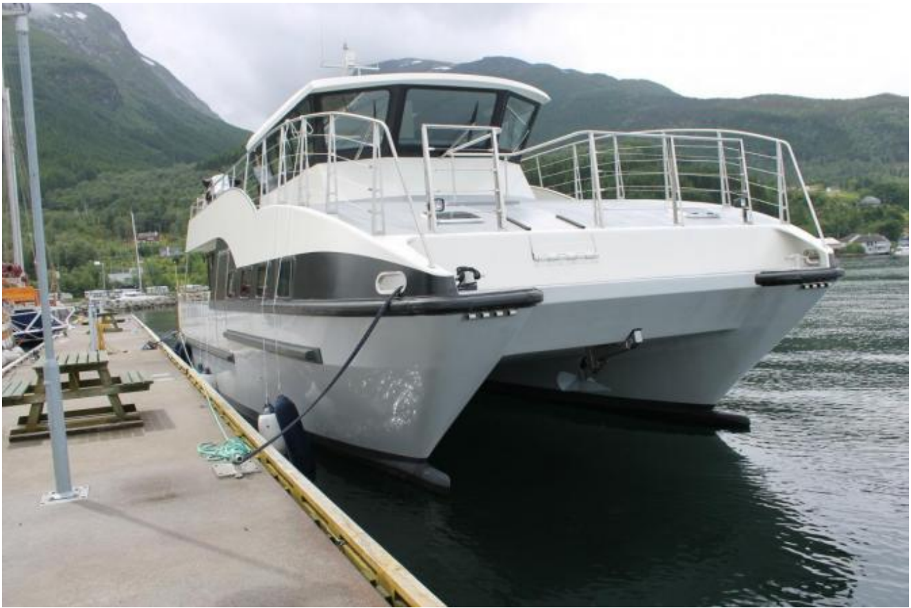
Rabbetussa ruvar ved bylgjebrytaren

Paret er frå Sogn men det er i Skodje 3 mil frå Ålesund dei har lagt ned livsverket sitt som yngste sonen no har teke over.