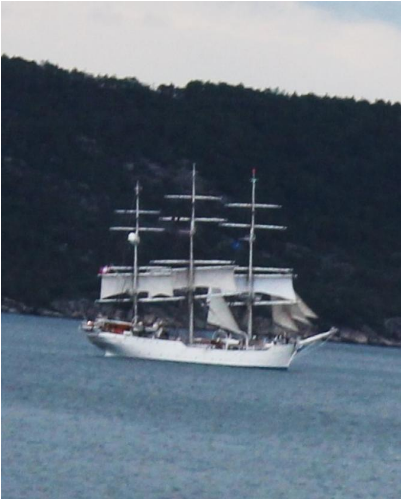
Christian Radich gjennom Storsund i kveld

Fullriggaren Christian Radich frå Oslo gjekk gjennom Storsund i kveld, ikkje for motor, men med mange av segla oppe. Det er sjeldan vi ser så store seglskuter for segl inn Gavelen og gjennom Storsund. Tronge farvatn og den vanskelege kvinnersvinden lager problem. Segla vert som regel berga før dei kjem så langt inn i fjorden.