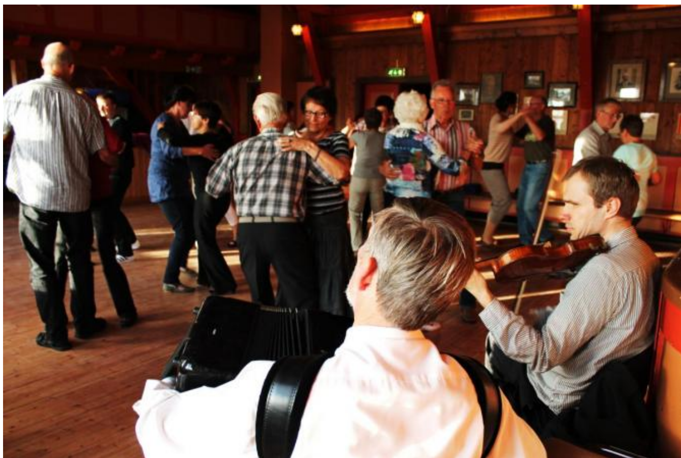
Og så var det dans til slutt..