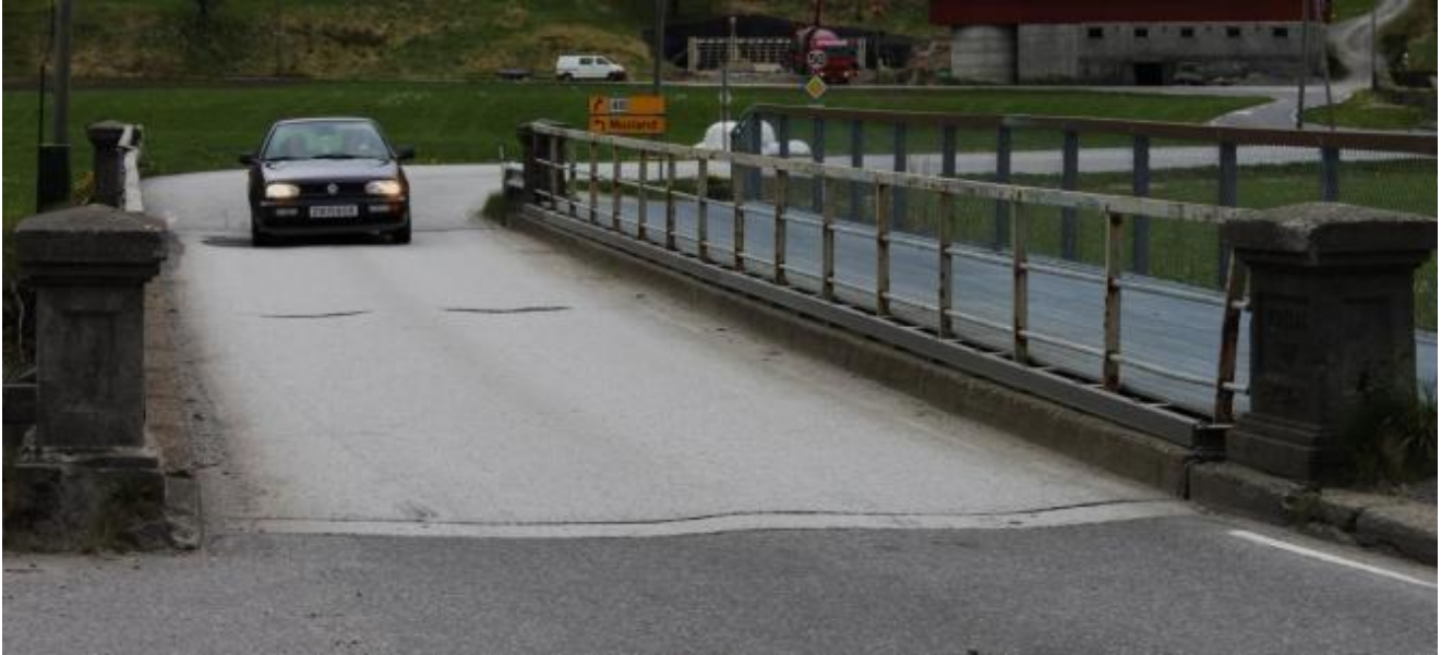
På avstand ser brua vår relativt fin ut...

For få dagar sidan hadde Grenda ein reportasje der eit knippe sjåførar i Tide påpeika kor elendig brukvalitet vi har i Kvinnherad..Konklusjonen var at nesten alle bruer er svært smale og at mange har dårleg og ujamt dekke.Det fører til at det ristar kraftig når ein køyrer over.