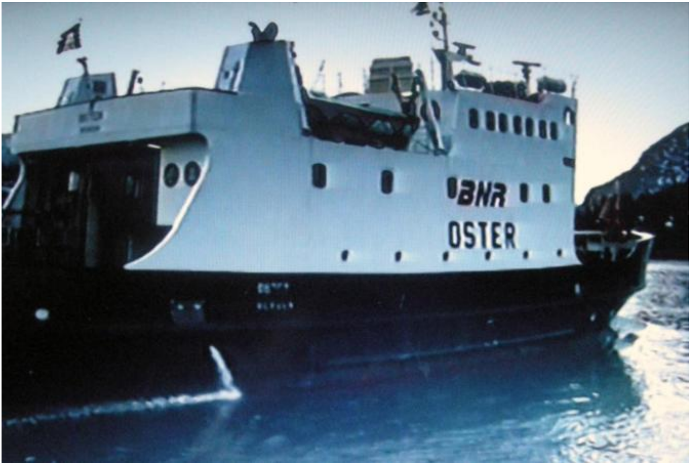
Ei av dei presenterte ferjene er Oster, som gjekk mellom Stamneshella og Vikanes ( Foto frå filmen)

Stort sett er opptaka gjort i 1996 og sjølv om det berre er 16 år sidan har allereie ruteopplegg og trafikkmonster gjennomgått betydelege endringar. Det kan ein lett registrera av opptaka og ikkje minst difor er dei så verdifulle.