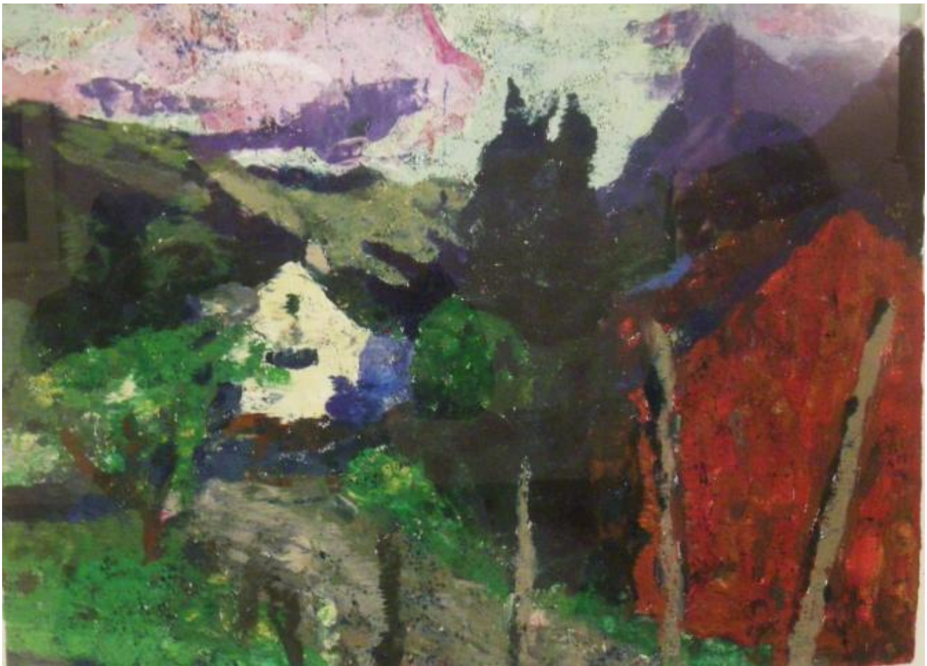
Motiv frå nedre del av dalen

Til neste år stiller ho kanskje ut i Drammen, som neppe kan seiast å ha ein høg finkulturell posisjon. Men å bu der er greitt nok.