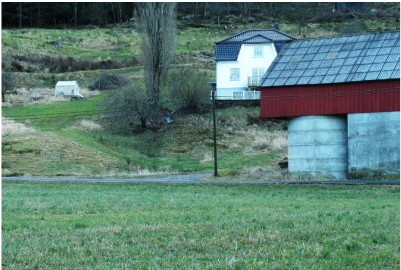
Det trengs ein ny avkøyrsløse like ved løa