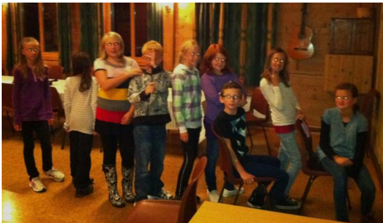
I kø for reflekstevling i bedehuset

Eg er tøff med refleks. Det er mottoet for dei i Uskedalen som no engasjerer seg i refleksveka til Hobbyklubben. Veka starta i kveld i Bedehuset og ein kan trygt kalle det ein knallstart ettersom det møtte bortimot 30 entusiastiske ungdommar.