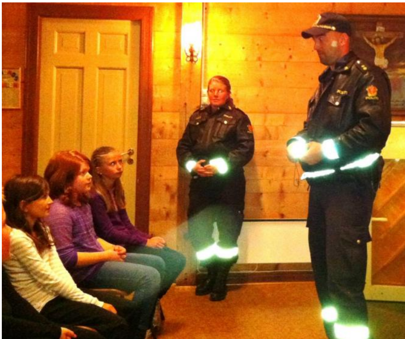
Også politiet kom til opninga

Onsdag held veka fram med utdeling av refleks på skulen og i begge barnehagane av Hobbyklubbens medlemmer, Dei vil også ta eit tak for den gode sak fredag og laurdag utanfor SPAR.