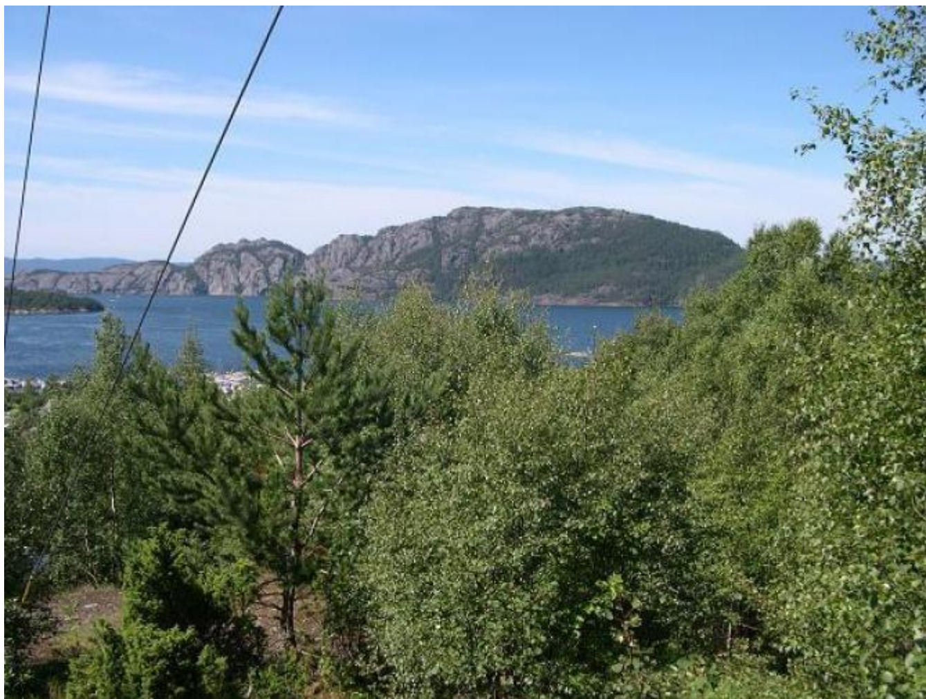
Slik var det i 2007

Men så såg ein i altfor mange år inn i ein grøn vegg. Og det var sterkt å beklaga, ettersom det er lagt fint til rette med bord og benkar rundt toppen. Det er ein stor fordel å rydda etter lauvfallet, påpeikar ein som har irritert seg over den grønne veggen.