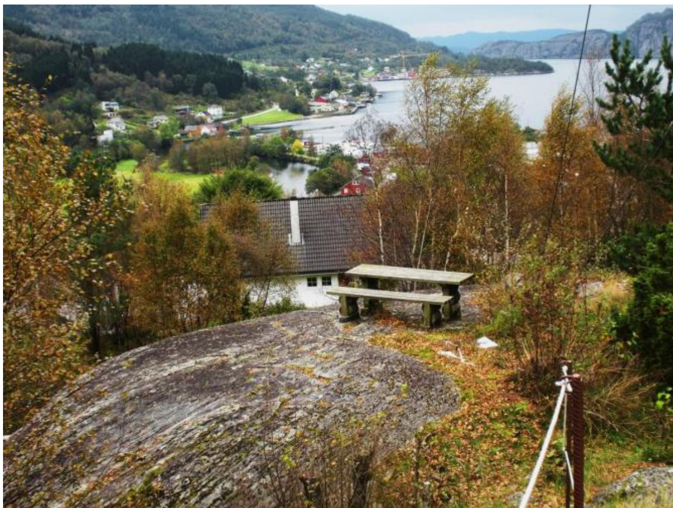
Det står att noko rydding..

Lauvfallet er rett om hjørnet og dermed blir det mogeleg å nytta panoramaet frå Skårhaug. Men rett skal vera rett: Det ljosnar i Skårhaug. Fleire grunneigarar med ansvar for vegetasjonen som var iferd med å ta overhand har gjort ein innsats med rydding i seinare år. No kan ein sjå fleire sentrale delar av sentrum frå utsiktsplassen som. eigentleg er ei perle.