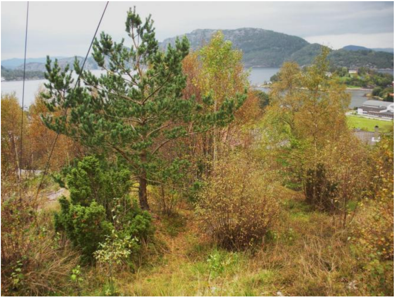
Slik er det i 2011