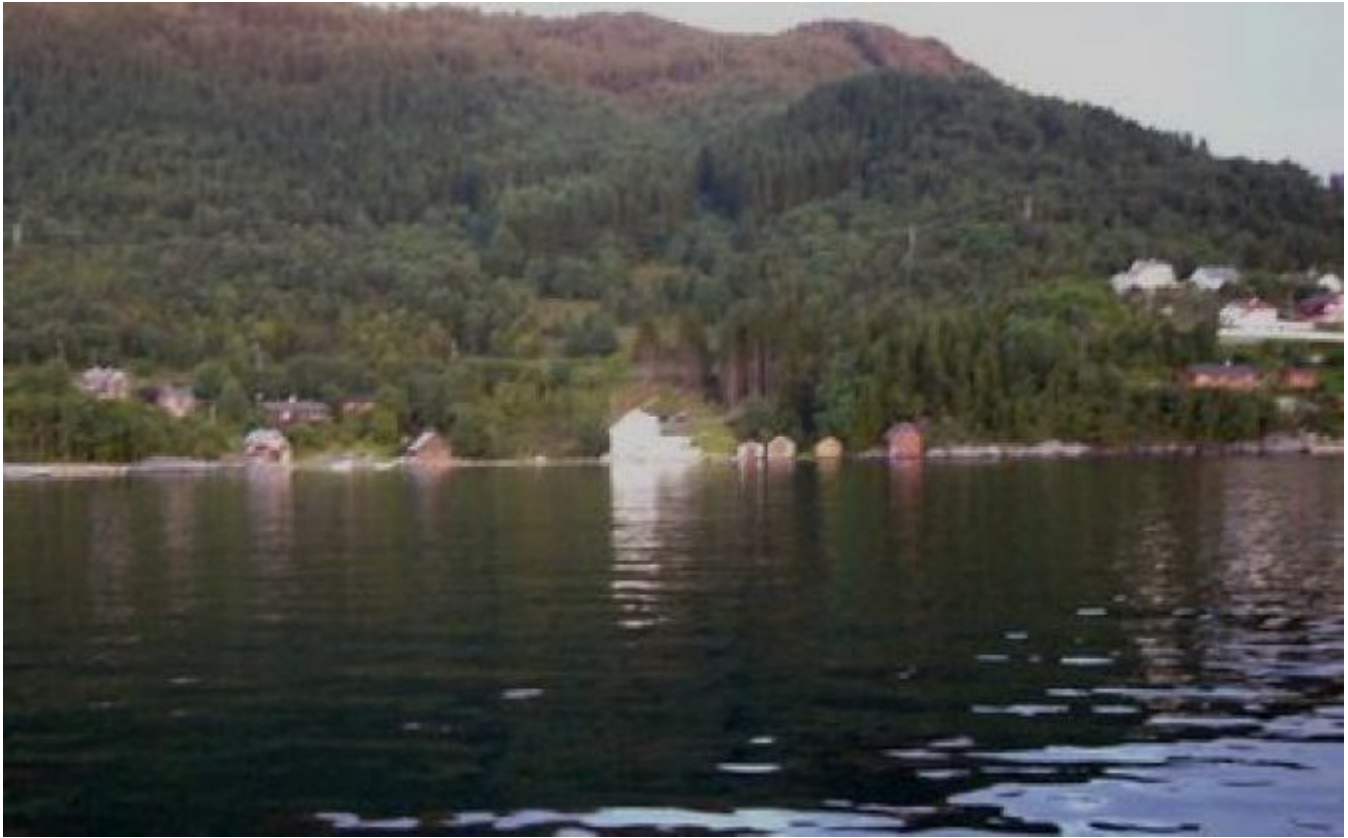
Det aktuelle området sett frå sjøsida (til høgre for det raude naustet)