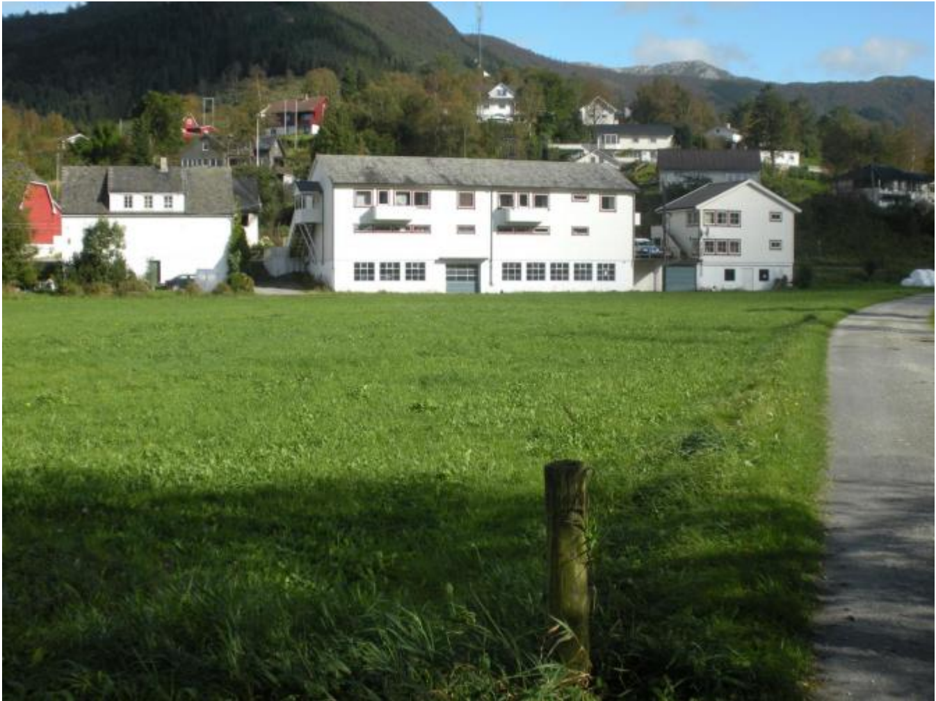
Kva som skal og kan skje på dette området er eit av spørsmåla som må klargjerast

Dn første og største utfordringa no - etterat fylkesmannen har trukke motsegna mot reguleringsplanen for turistanlegga - er vurderinga som skal gjennomførast av flaumfaren. Det slår verksemdsleiar Tormod Fosheim fast etter at han i ettermiddag har hatt eit møte med dei 2 turistvertane Steinar Myklebust (Rabben) og Geir Enes (Øyro). Det er NVE som har bedt om ei vurdering av flaumfaren før det blir tillete plassering av campingvogner og oppsetting av hytter.