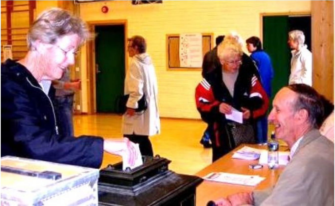
Valet i 2007 er igang og urna frå 1903 i funksjon.

Det er ingen endringar i prosedyren for valet samanlikna med valet for 4 år sidan. Det gjeld også dei stadane vi skal røysta her i Uskedalen. Aktivitetshuset er stemmetaden og røystesetelen ser ut som sist og skal handterast på same måten. Men let oss ta det systematisk. Har du fått valkort skal du ta det med, for det lettar prodedyren. Det gjeld både for fylkestingsvalet/kommunestyrevalet og kyrkjevalet. Du skal også ta med legitimasjon.