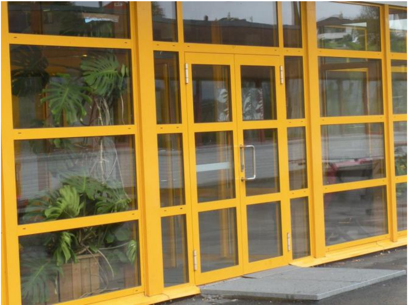
Her skal du inn hvis du skal velge sokneråd og bispedømmeråd

Denne gongen er du ein av 763 som har røysterett i Uskedalen - 2 færre enn for 4 år sidan. Du har 9 lister å velgja mellom ved kommunestyrevalet og 15 ved fylkestingsvalet.