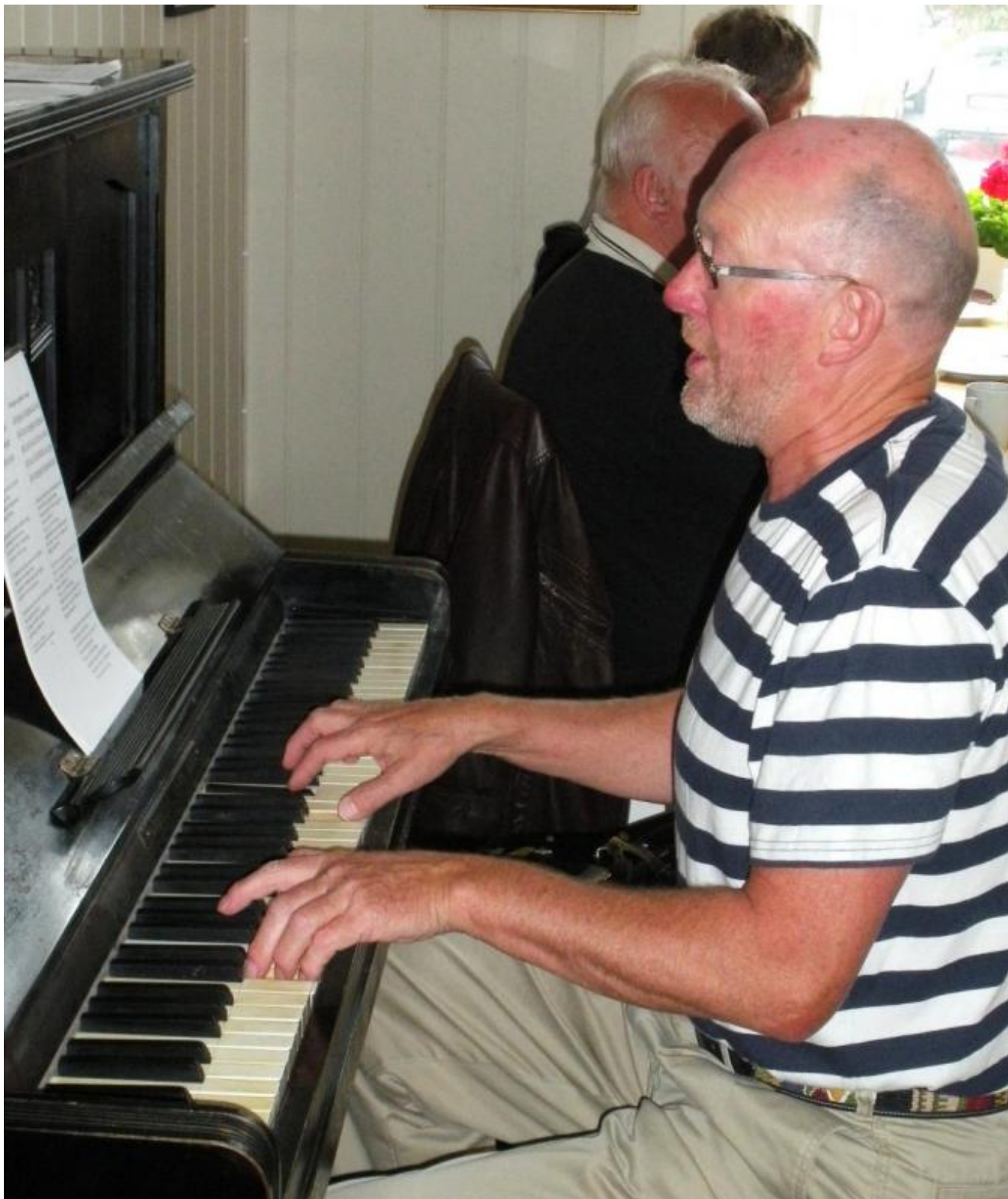
Pianoet frå Kjærland gjorde teneste

Dei to hadde til og med to avdelingar - både klokka 12 og 13 - og repertoaret var tildels fornya i avdeling nummer 2! Songane var kjende og kjære - frå No kjem ein vals til Dei skal alltid klaga og kyta.