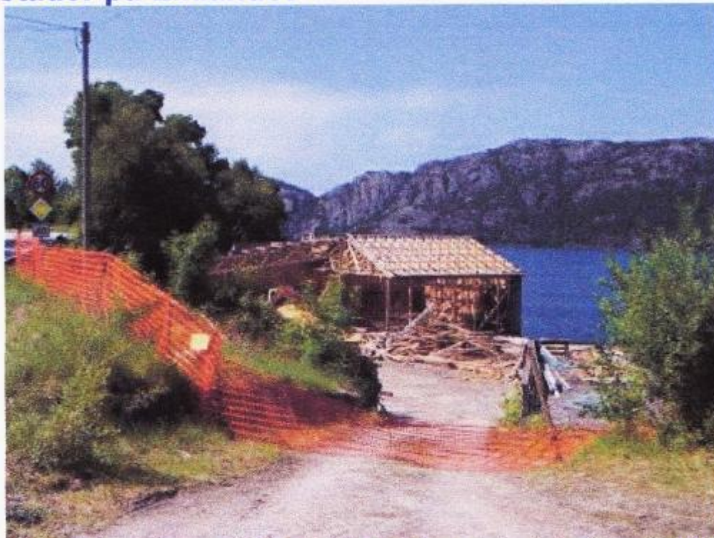
Det gamle trelastlageret på Eiklandet blir erstatta av einebustadar.