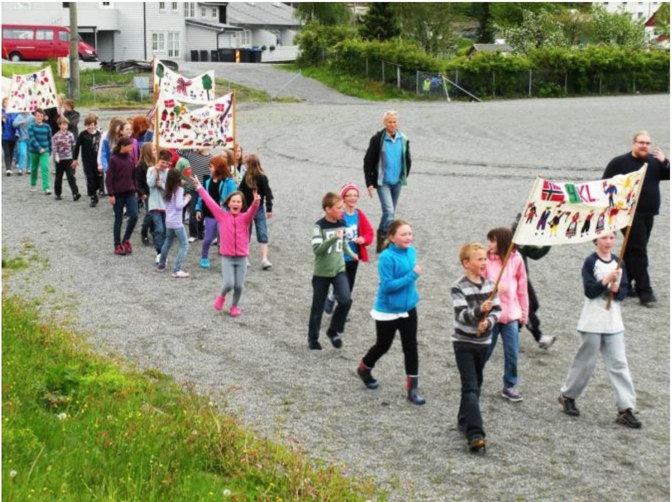
Skulen og barnehagen er godt rusta. Her er treninga på grusbana i gang i føremiddag.