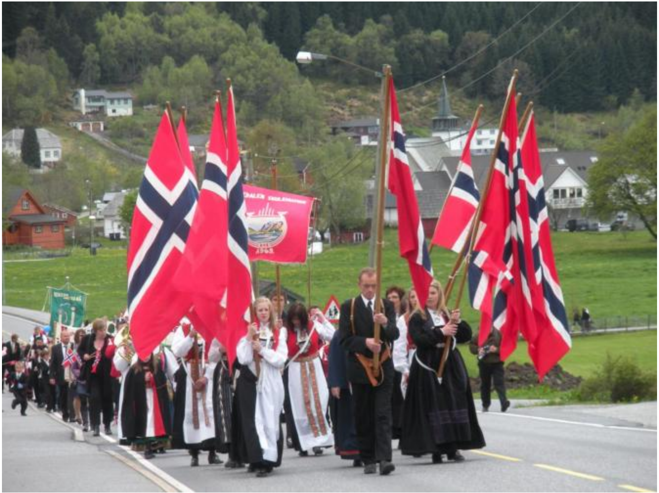
Toget på veg opp mot Brekketoppen i fjor. I år går det til Feet.

Så er det meste klårt for den store Dagen også her i bygda og det tradisjonelle opplegget blir etterlevd. Men nokre endringar blir det og ikkje alle er positive. Mange vil beklaga at det ikkje vert korpsmusikk i toget fordi skulemusikken har for få musikantar.