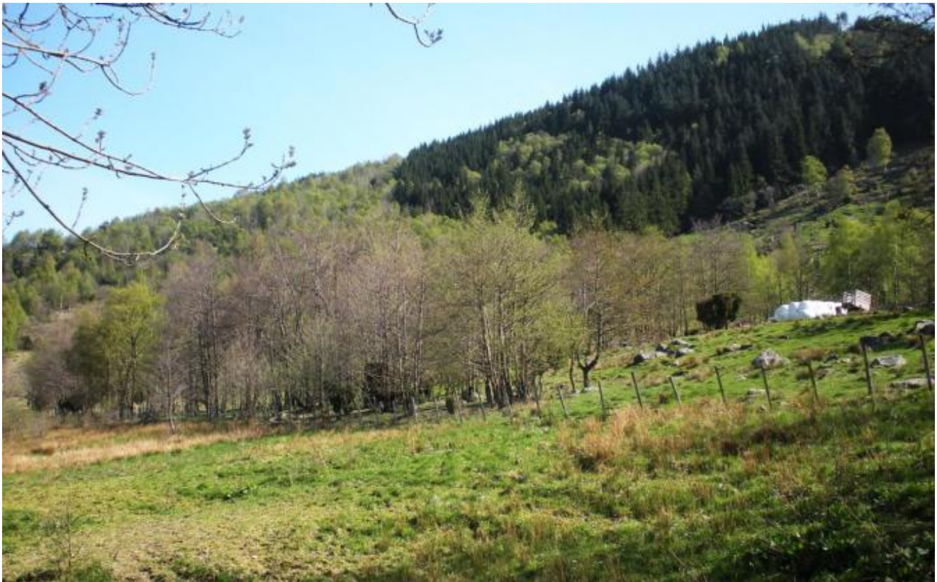
Er det fare for skred i dette området?