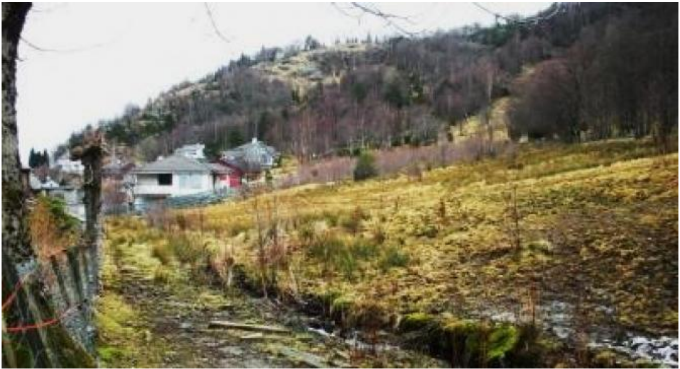
Skredfaren i planområdet skal vurderast av ekspert