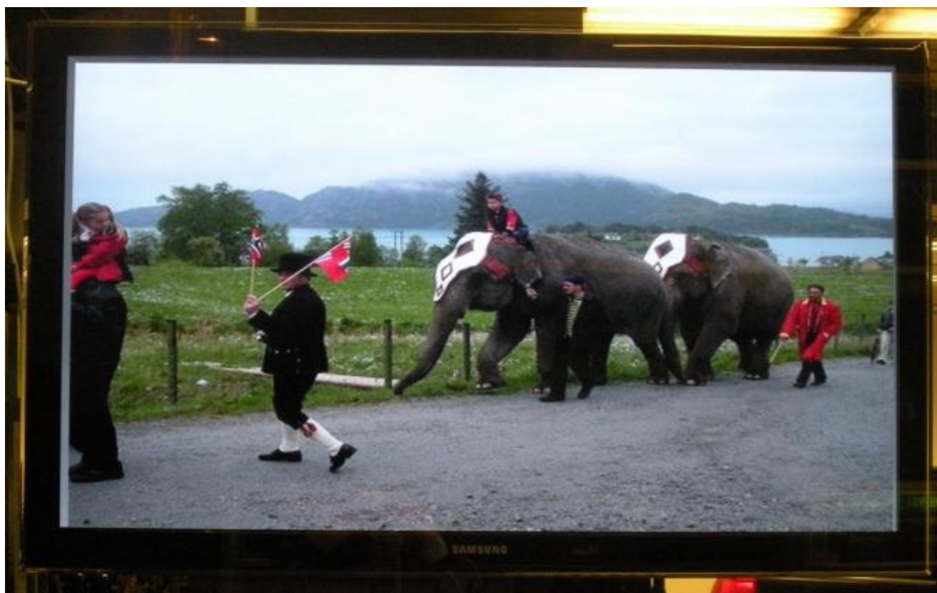
Hugsar du då Arnardo var med og feira 17. mai? Foto frå skjermen i Auto 88

Eit nytt og sterkt lokalretta informasjonstilbod er monterrt i dei tidlegare kioskløkala med ein liten skjerm inne og ein stor på 46 tommer som ein kan sjå på utanfrå. Det skjer best når det er mørkt.