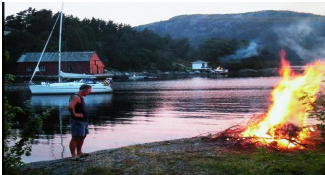
Stemming frå Neset - foto frå skjermen i Auto 88

Mens du ventar på dekkskift eller anna i Auto 88 vil du heretter ikkje ha noko problem med å få tida til å gå.