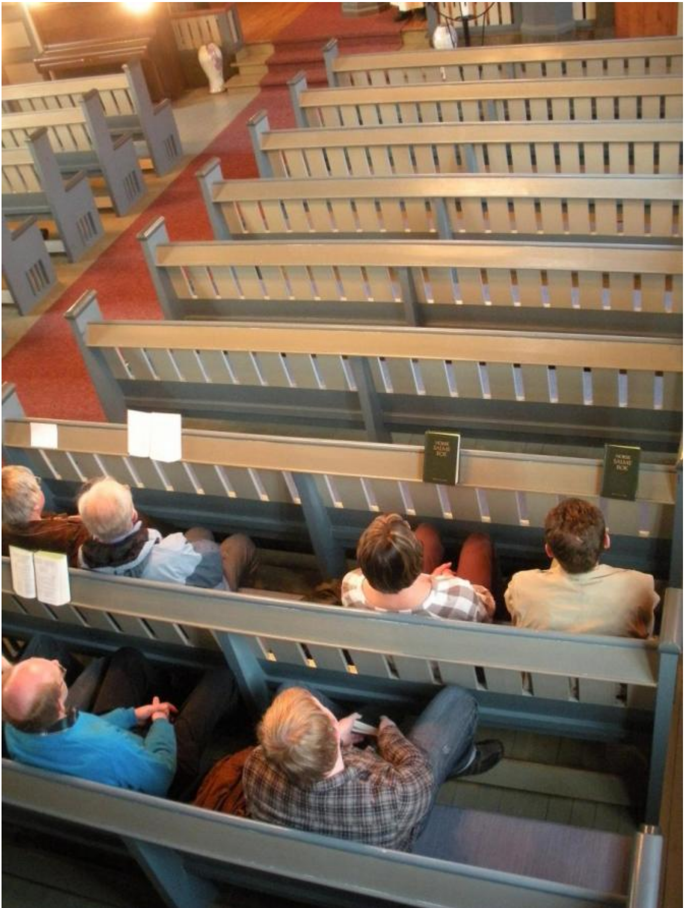
Det kom berre 20 i kyrkja i kveld