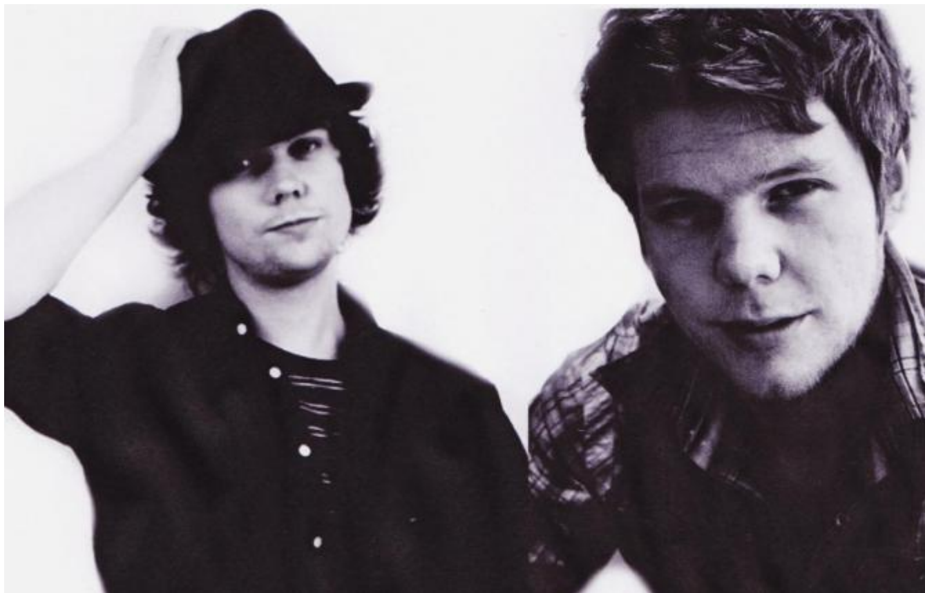
- og her er brørne frå Alvdal