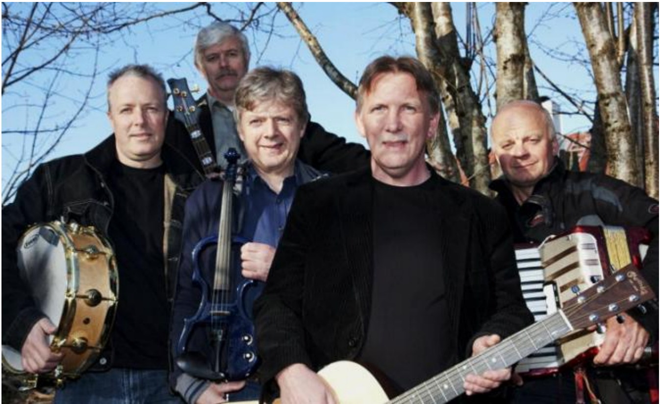
Dette er dei summande biene!