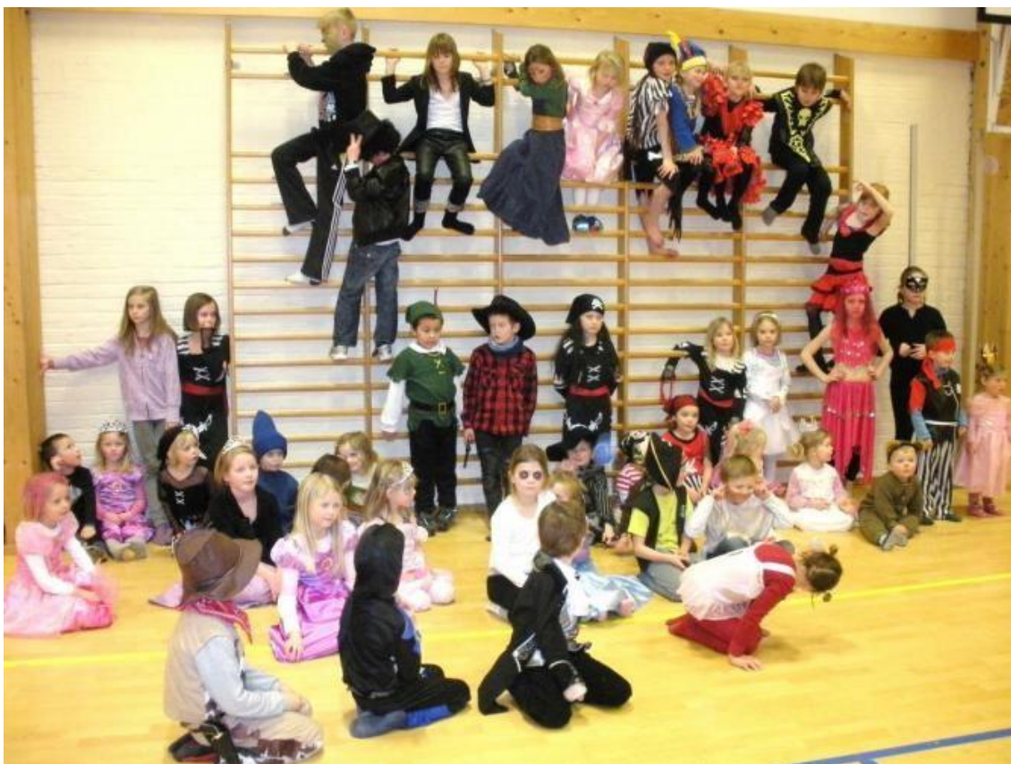
Nesten 50 kom på karnevalet!

Fantasien kjente ingen grenser her heller med omsyn til antrekk. I kveld i Aktivitetshuset såg ein alt frå pirnsessar og indianarhovdingar til sjørøvarar og spøkelses. Men nesten alle såg ut som om dei hadde kvikksylv i kroppen.