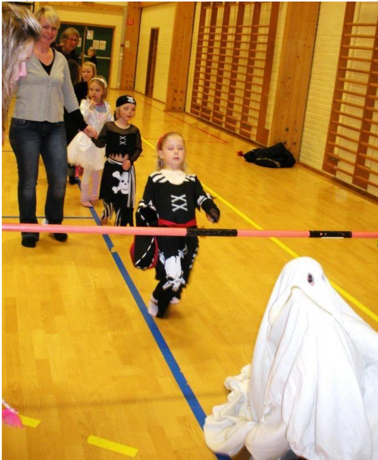
Limboen går: Eit spøkelse har nyleg passert lista og no kjem ein sjørøver!

Fredag 4. mars går startskotet for karnevalet i Rio.