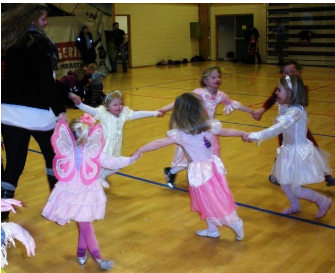
Kva skal ein kalla det - runddans?

Fantasien kjente ingen grenser her heller med omsyn til antrekk. I kveld i Aktivitetshuset såg ein alt frå pirnsessar og indianarhovdingar til sjørøvarar og spøkelses. Men nesten alle såg ut som om dei hadde kvikksylv i kroppen.