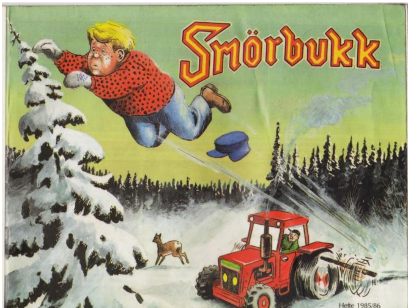
Smørbutikk lever framleis