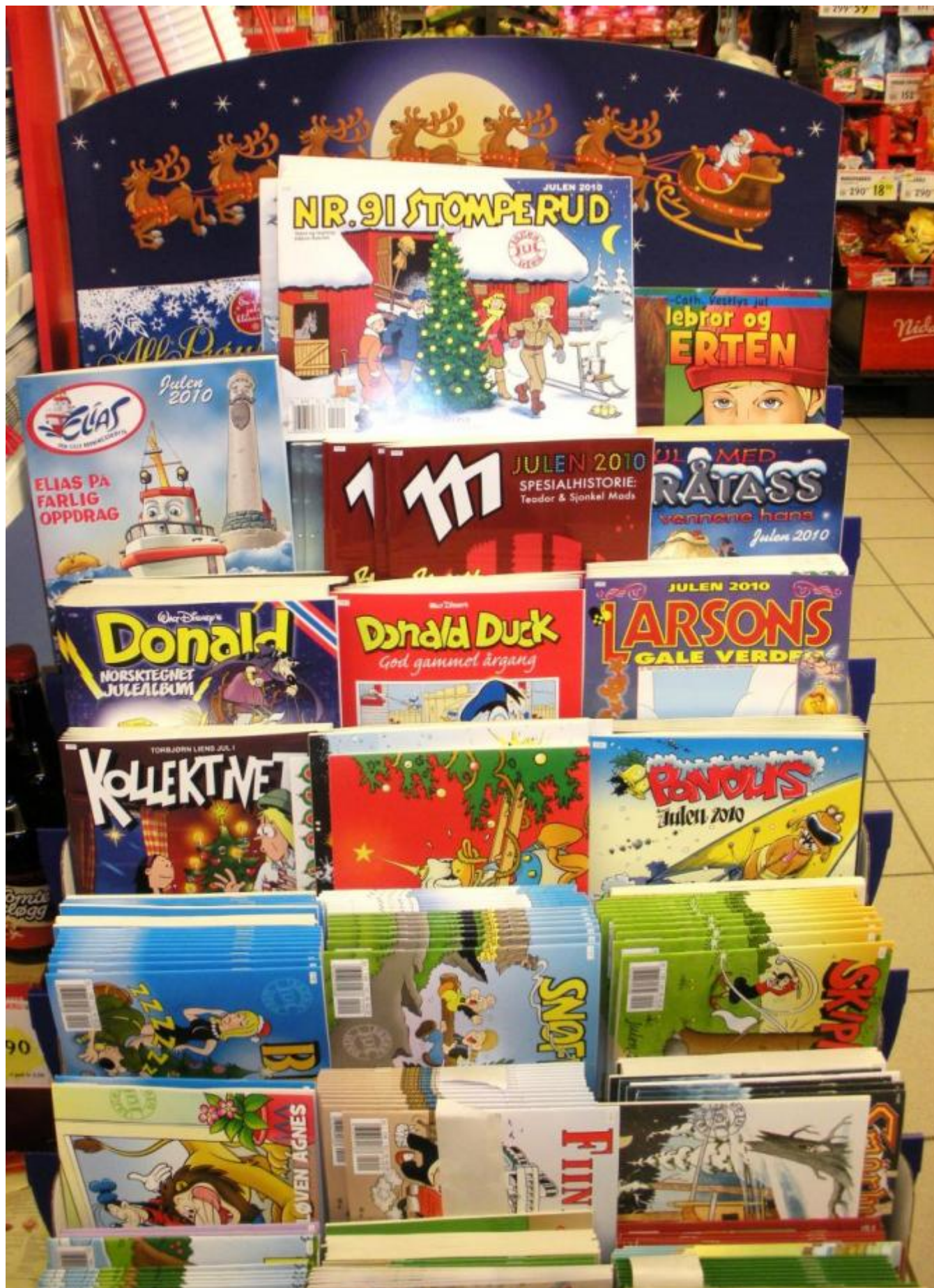
Det er mindre juleheftesal no enn før

Vi kjenner alle dei tradisjonelle julehefta i teiknserieform for born, Smørbukk, Tuss og troll, Vangsgutane, Blåmann og Knoll og Tott. Av slike finn vi heile 55 ulike julehefte i sal i jula 2010.